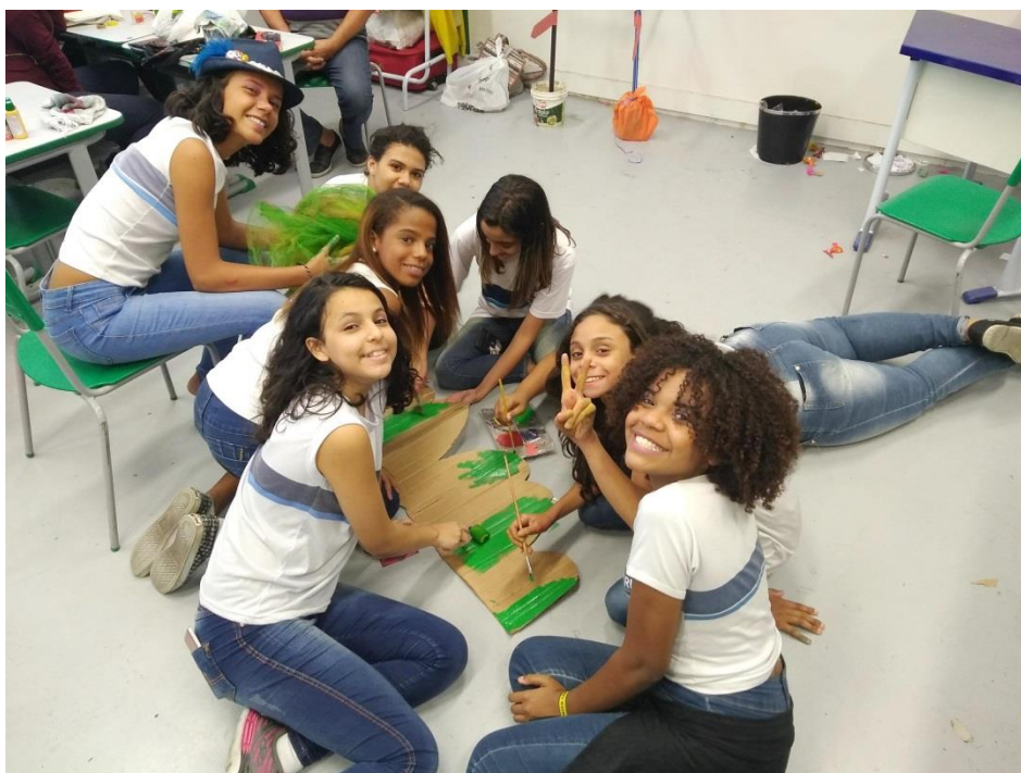
Imagem 18 – CRIANDO O CENÁRIO

7. Apresentação: Tudo pronto. Desde que começamos o processo, nossa primeira apresentação é realizada no Festival de Teatro de Alunos da Rede (FESTA). Nessa fase, eu também deixo os alunos conduzirem todos os preparativos, incluindo a maquiagem. Eles contam com o meu apoio e de alguns outros professores, mas de forma alguma assumimos a responsabilidade. Eles são protagonistas dentro e fora de cena.