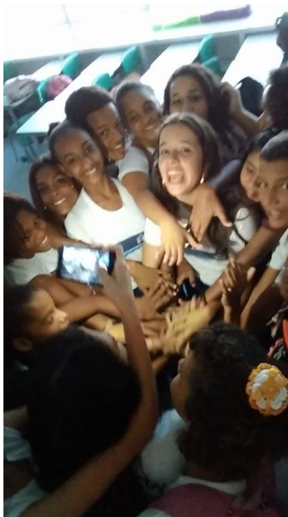
Imagem 12 – FAMÍLIA DO TEATRO

Ao final de todas as aulas, nós nos reuníamos em círculo, todos com as mãos ao centro e gritávamos “turma do teatro”. Um dia, um deles sugeriu que nós gritássemos “Família do Teatro” e assim está sendo até hoje. E é sobre o processo desse grupo, que se reconheceu família, que eu vou falar agora.