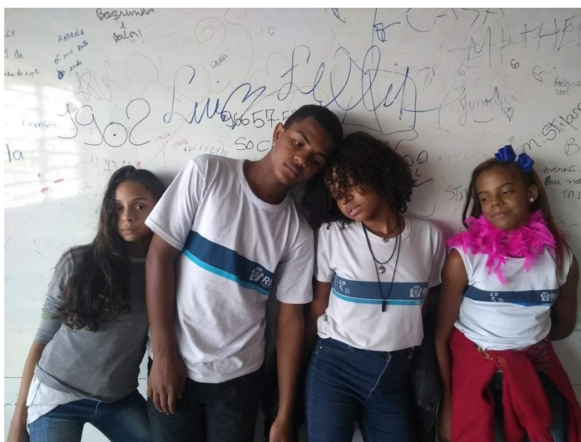
Imagem 6 – SOMBRA