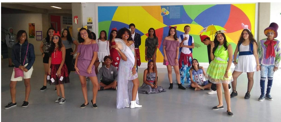
Imagem 10 – ALICES

Em 2018, desenvolvi, ao lado da minha turma de eletiva, um espetáculo baseado em “Alice no País das Maravilhas”, de Lewis Carroll. Foi um trabalho extremamente especial, e o motivo foi muito simples: era um trabalho deles. Do mesmo modo, em 2019, desenvolvemos uma peça chamada “A Reviravolta das Histórias”, em que diversos personagens de diversos universos embarcavam juntos em uma aventura sobre a importância do respeito e da leitura.