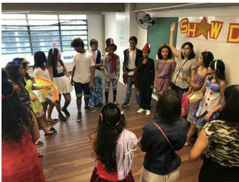
Imagem 19 – FALAR E OUVIR

Esse capítulo será dedicado a falar em particular sobre as mudanças visíveis em alguns alunos 1 que fizeram parte do grupo de teatro, bem como revelar alguns exercícios que foram utilizados pensando no amadurecimento e transformação do grupo e de cada um que estava presente. Libertar o potencial durante as aulas de teatro tem pouquíssima relação com o desenvolvimento deles enquanto artistas. Eu estou muito mais interessada em saber se eles evoluíram dentro de suas próprias limitações e superaram seus limites.