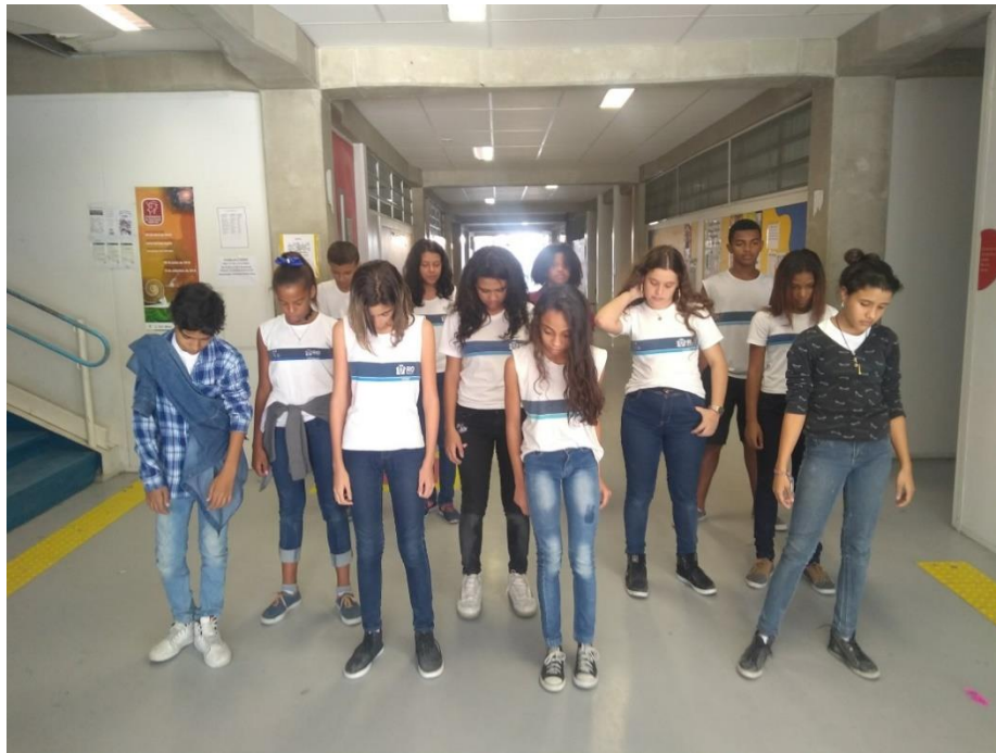
Ocupando a escola: teatro nos corredores