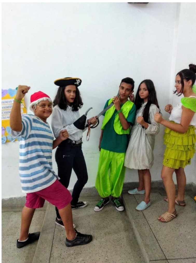
Imagem 5 – PERSONAGENS

Sobre a fonte, denominada anteriormente de inconsciente coletivo, é importante saber que ela se diferencia do inconsciente pessoal porque sua existência é independente de suas experiências individuais, funcionando como uma espécie de reserva de imagens. Mas não estamos falando aqui de nenhum tipo de comunicação espiritual com os antepassados. Não! São apenas inclinações e potencialidades para experienciar e replicar ao mundo tal como os antepassados. Exemplifico: para algumas pessoas, não é necessário passar por experiências traumáticas para se temer trovões ou o escuro. O medo de trovões e da escuridão pode ser inerente a qualquer tipo de vivência, ou seja, reagimos de certa maneira a determinadas situações também porque o nosso inconsciente coletivo está predisposto a elas.