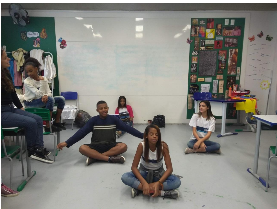
Última cena: Ensaio de Um Trio no País das Maravilhas na Sala de Teatro