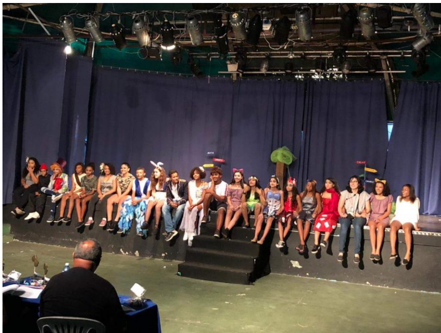
Todos Juntos no final da apresentação de Um Trio no País das Maravilhas, no Festival de Teatro da Rede. Prontos para ouvir a fala dos jurados.