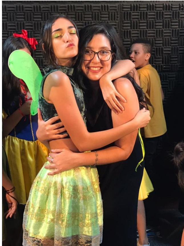
Pós espetáculo – Fada e Professora