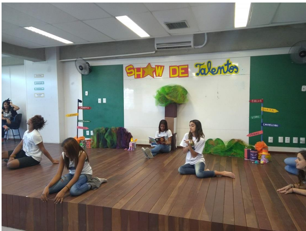
Imagem 7 - ENSAIANDO A MUDANÇA

Eu não quero, em nenhum momento, colocar o ensino de Teatro como única ferramenta fundamental para o desenvolvimento das crianças e adolescentes. Eu estou defendendo um novo olhar para a educação artística, com mais equidade entre todas as disciplinas. O que eu estou tentando apresentar por meio de teoria e prática é a importância do teatro na educação básica, sua relevância enquanto disciplina independente.