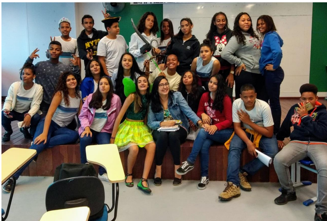
Final da aula-ensaio no auditório: Sininho feliz com seu personagem