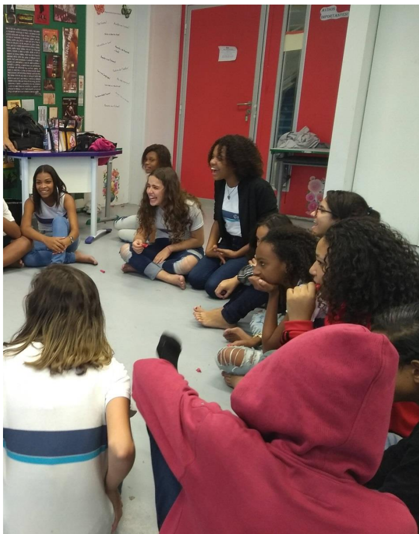
Imagem 15 – CONTANDO HISTÓRIAS

Na entrevista (ANEXO 4, p.90-91), os personagens já foram divididos. É um exercício muito simples, embora desafiador, e eles gostam muito. Eu faço uma roda e um aquecimento simples, buscando a concentração e unidade do grupo. Em seguida, eles caminham pelo espaço e eu vou dando algumas indicações: para pensarem em como o personagem deles vai caminhar, qual a voz desse personagem, como ele fala, se