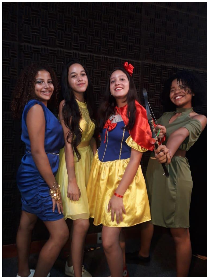
Princesas corajosas e guerreiras de A Reviravolta das Histórias