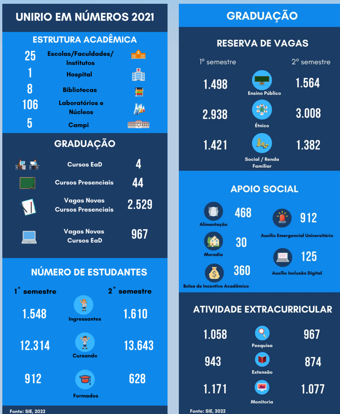
Figura 7 – UNIRIO em Números 2021