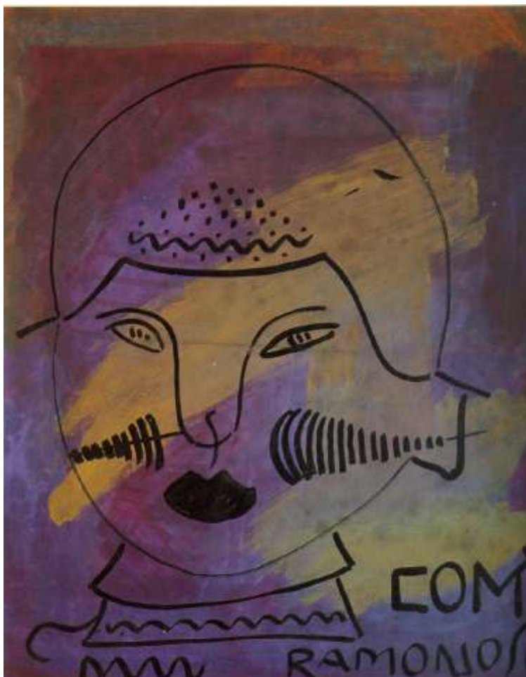
Fig. 12 Raphael Domingues Guache sobre papel Acervo do MII