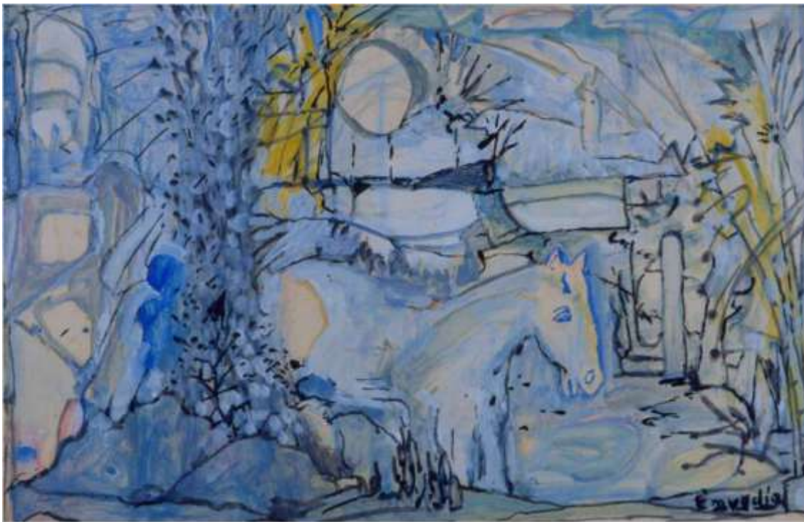
Fig. 15 Emygdio de Barros Óleo sobre papel Acervo do MII