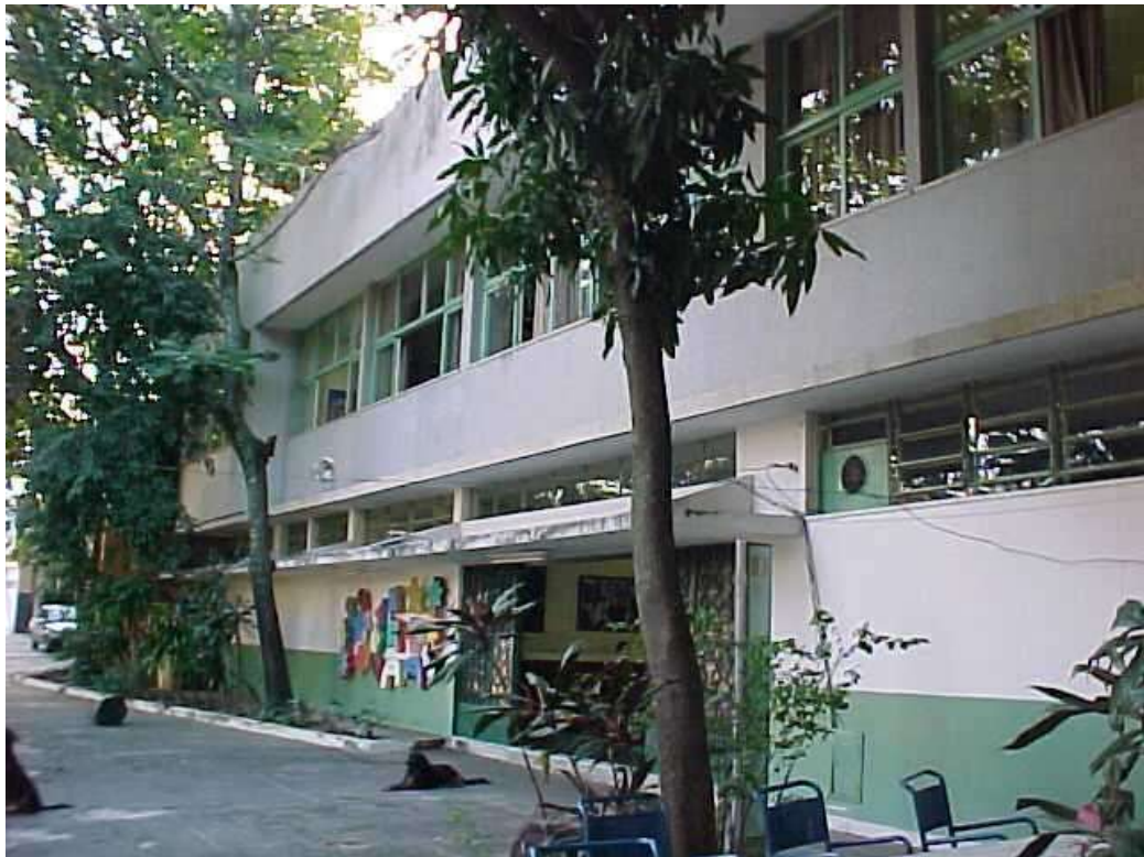
Fig. 2. Fachada principal da sede do Museu de Imagens do Inconsciente