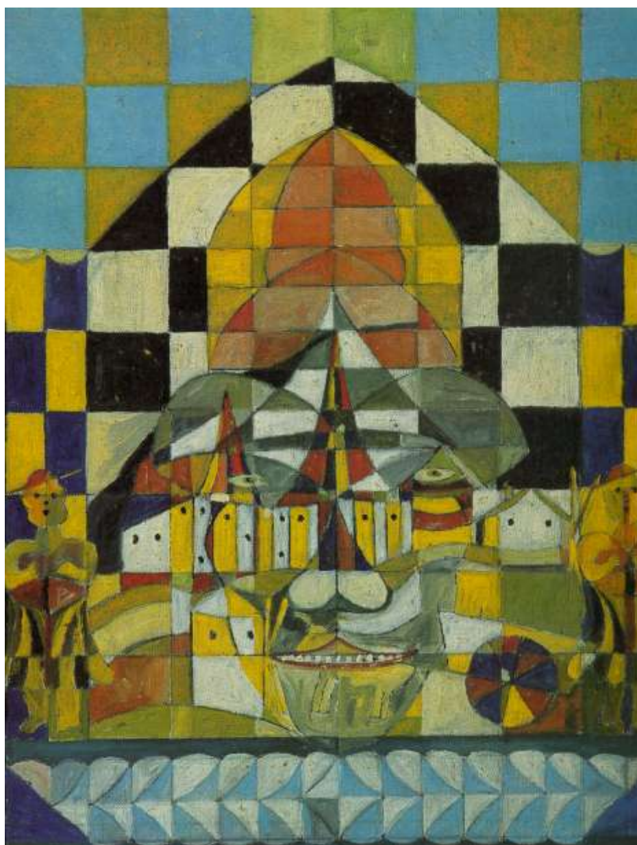
Fig.19 Carlos Pertuis Óleo sobre tela Acervo do MII

Essa experiência profundamente humana, este convivium difícil de encontrar no cotidiano de nossa sociedade globalizada, onde o lúdico, o inspirador, o criativo estão amalgamados, é um patrimônio ético, moral e cultural que, pertencente a um espaço e tempo qualificados, é intrinsecamente ligado à alma brasileira, e que pelo seu profundo compromisso com o ser humano alcança a universalidade.