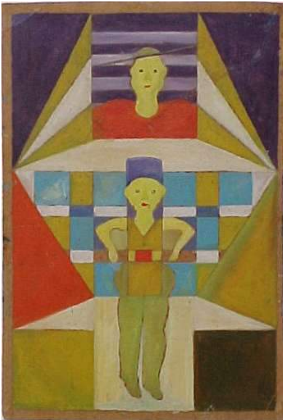
Fig. 1: "O trapezista" Carlos Pertuis Óleo sobre papel Acervo do Museu de Imagens do Inconsciente