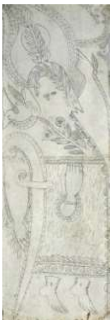
Fig. 10. Obra da Coleção abcd

coleção particular organizada por Bruno Decharme 16 , o desenho de um autor brasileiro desconhecido que indiscutivelmente pertence à coleção do Juquery, haja visto sua semelhança com outro publicado no livro de Osório César: