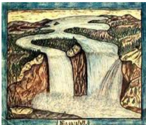
Fig. 8. “Niágara” – Obra da coleção Morgenthaler