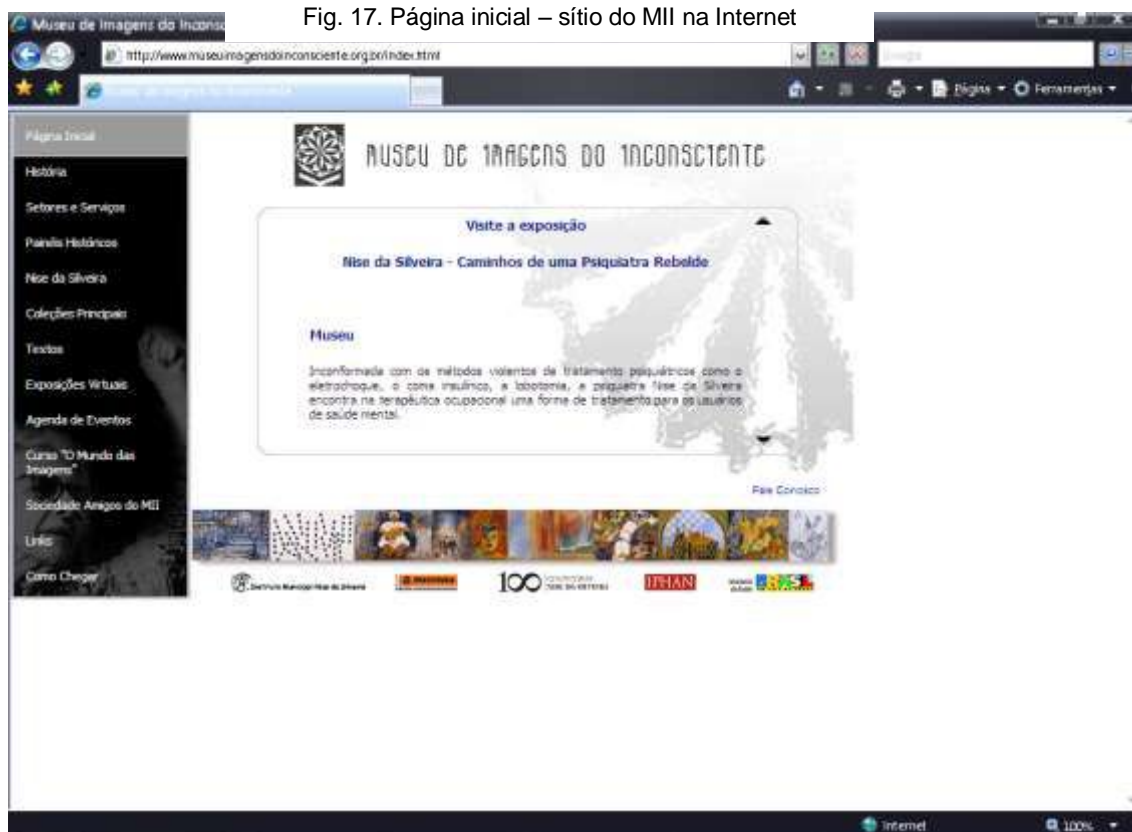
Fig. 17. Página inicial – sítio do MII na Internet

Garantido o acesso às informações, sua disseminação seria feita também pelo estreitamento de laços com organizações similares, tais como o ARAS, O Instituto C. G. Jung de Zurique, e tantas outras associações dedicadas ao estudo e pesquisas na área da psicologia analítica, do simbolismo das imagens.