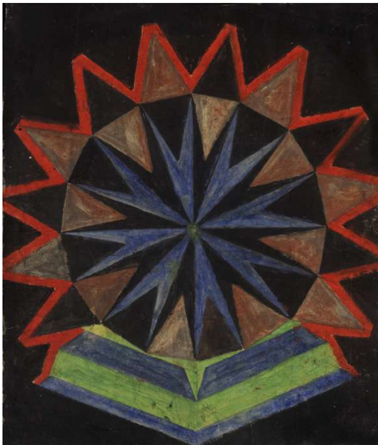
Fig. 13 Carlos Pertuis Óleo sobre jornal Acervo do MII