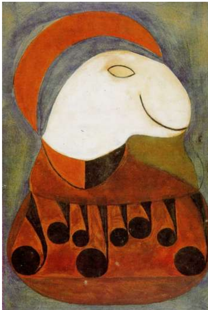
Fig. 18 Carlos Pertuis Óleo sobre papel Acervo do MII