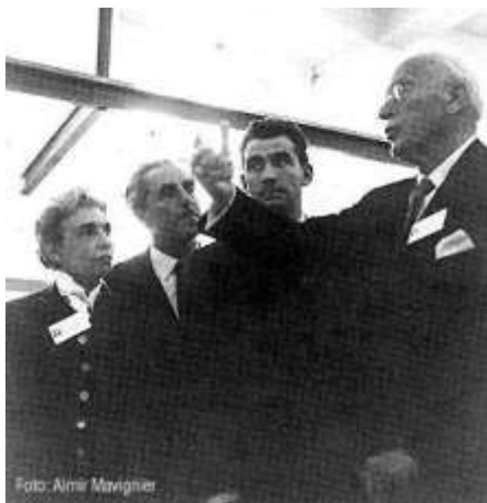
Fig. 4. Jung (à direita) e Nise (à esquerda), na inauguração da exposição A Esquizofrenia em Imagens

A partir de então, vários contatos entre a Dra. Nise e C. G. Jung sucedem-se, tendo a mestra posteriormente realizado estudos no Bild Archiv (arquivo de imagens) do Instituto C. G. Jung em Zurique, graças a uma bolsa de estudos da Organização Mundial de Saúde.