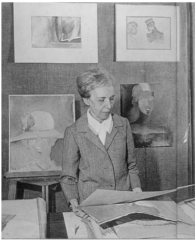
Fig. 3. Nise da Silveira na sala de exposições da antiga sede do Museu de Imagens do Inconsciente