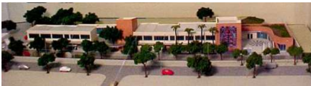
Fig. 16. Maquete do projeto para a nova sede do MII

projeto, que nunca foi executado, previa três espaços de atuação: reserva técnica, exposições e ateliês.