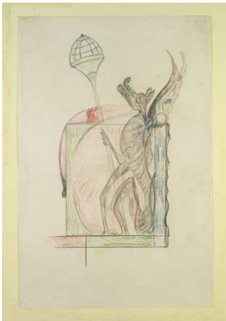
Fig. 5: Sem Título Octávio Ignácio Lápis de cor s/ papel Acervo do MII