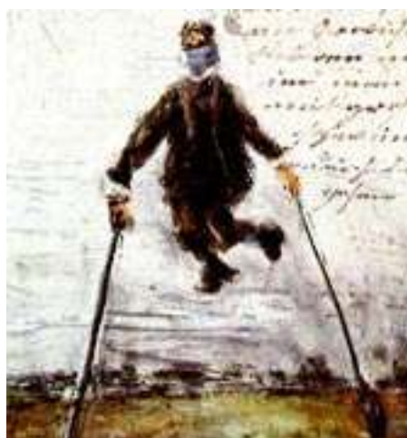
Fig. 9. Obra da Coleção Prinzhorn