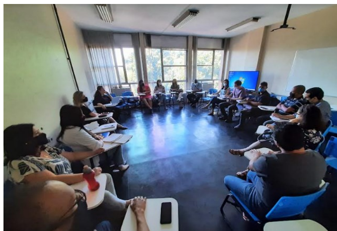
Reunião no Prédio da Nutrição na Urca

A primeira reunião foi realizada no Prédio da Nutrição na Urca e segunda na Sala de Atendimento da PROGEPE. Os servidores construíram em conjunto a missão da PROGEPE e ações de planejamento para o próximo ano. No dia 18 de novembro foi realizada uma reunião virtual com todos os servidores da PROGEPE.