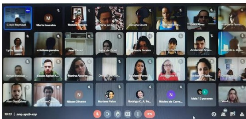
Reunião Virtual com os servidores da PROGEPE