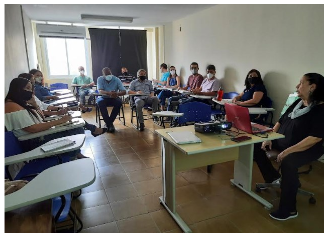
Reunião na PROGEPE no Centro