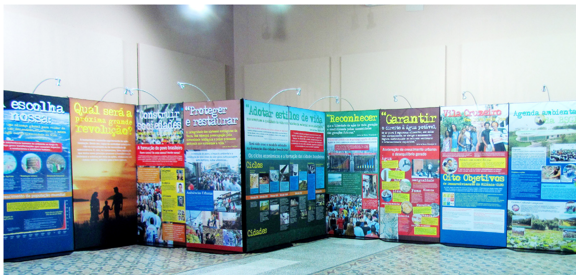
Estrutura física da exposição

A montagem “Sementes da Esperança” possui 24 painéis, dos quais um é reservado para os visitantes expressarem suas reflexões sobre as próprias ações, e a ala nacional “Ambiências Urbanas” é formada por 15 painéis.