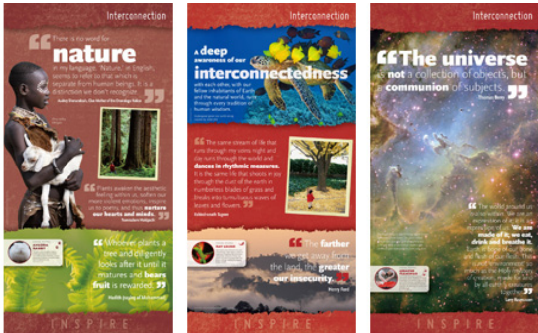
Primeira parte da exposição inspirado em frases e pensamentos

Além do mais, a primeira parte da exposição contém frases e pensamentos inspirados em antigas tradições e religiões de diversas partes do mundo, sábias referências para o “Desenvolvimento Sustentável”. Tendo em vista a visita de estudantes do ensino fundamental, a seção “Animais em Extinção” foi inserida na parte inferior de cada painel.