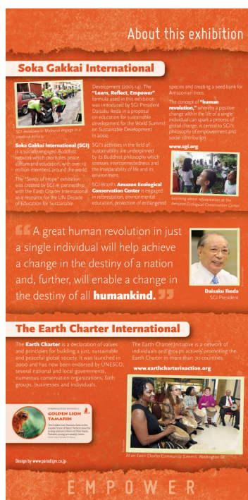
Painel sobre a SGI e a The Earth Charter International

Trata-se de educação no sentido mais amplo da palavra e não se limita às salas nem a um grupo em particular.