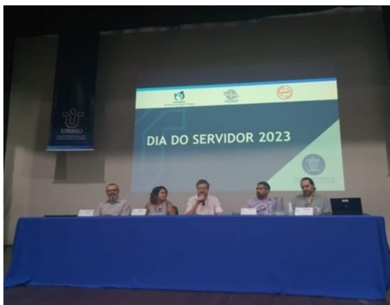
Evento em homenagem ao Dia do Servidor

PROGEPE realiza evento em homenagem ao Dia do Servidor Página 2