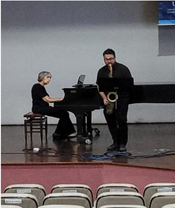
Apresentação musical de piano e saxofone