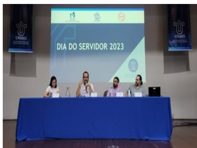
Mesa 1 sobre Carreira