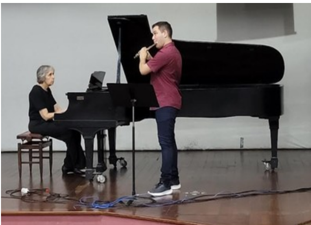
Apresentação musical de piano e flauta