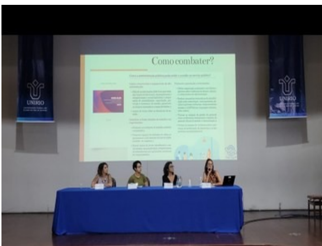
Mesa 2 sobre Prevenção e Combate ao Assédio