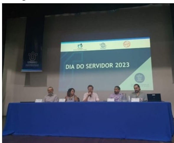
Mesa de Abertura