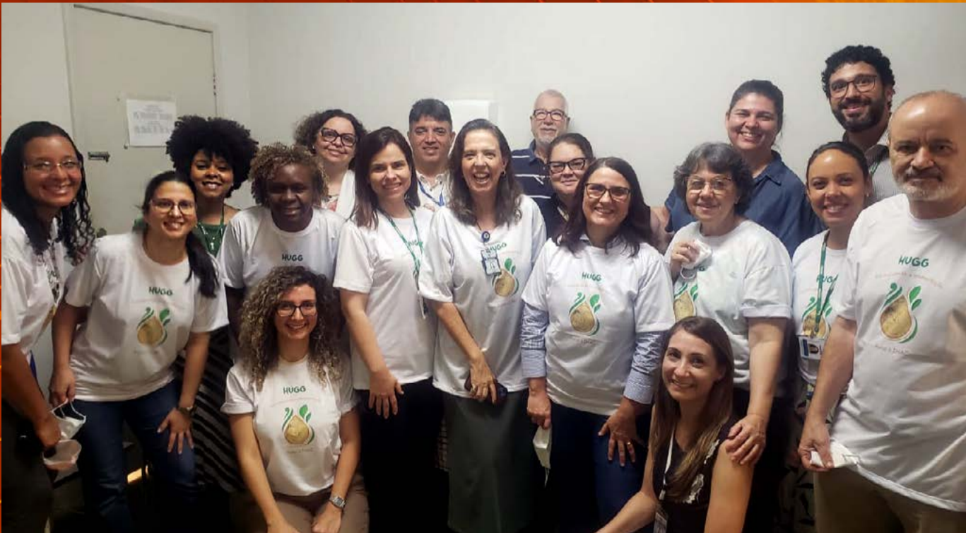
Comissão de Incentivo e Apoio ao Aleitamento Materno do HUGG