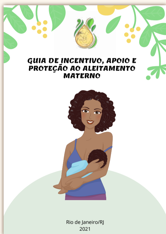
Capa do Guia de Incentivo, Apoio e Proteção ao Aleitamento Materno

Troca de experiências entre os cursos é fundamental para avançar no processo de conscientização e formação de alunos.