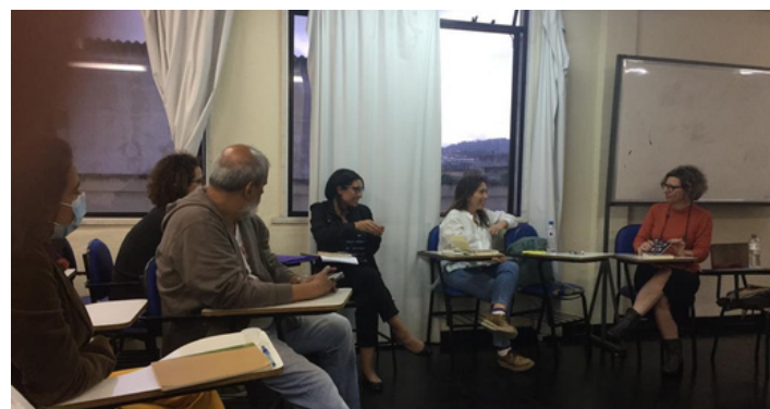
Reunião presencial do Grupo de Pesquisa do NUFT

A proposta é incentivar uma cultura do debate e das problematizações do campo das Letras e Humanidades. O caráter de laboratório permite dar prioridade a pesquisas em andamento e investigações que produzam ressonâncias no mundo e na vida contemporânea.