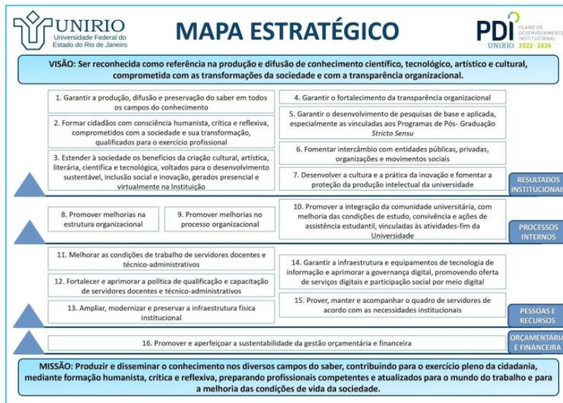
Figura 3 - Mapa Estratégico da UNIRIO