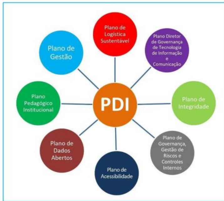
Figura 4 - Articulação entre os planos estratégicos da UNIRIO

Com base no PDI, todo o marco regulatório da Universidade foi elaborado e/ou atualizado, como mostra a figura 4, a seguir: