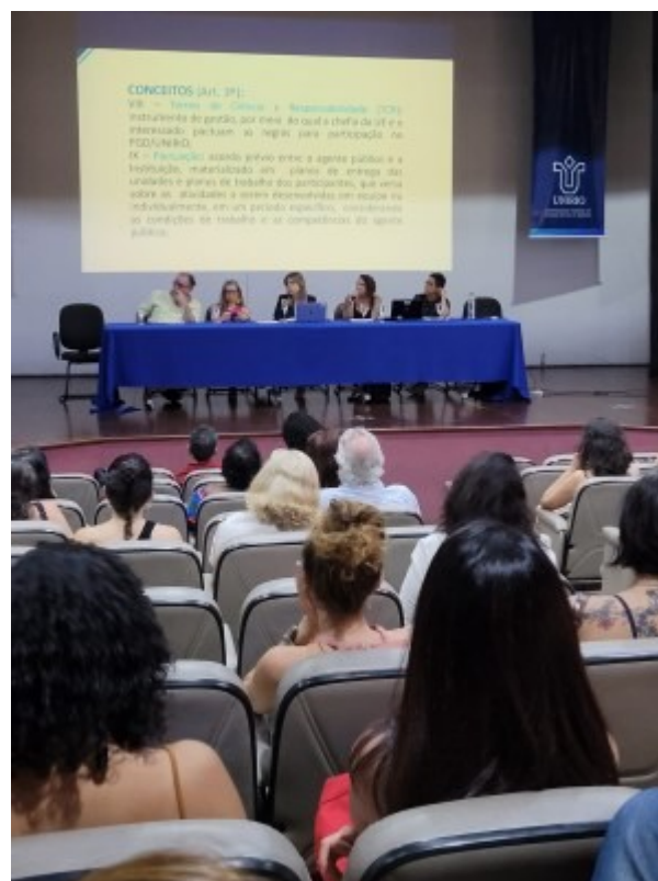
Servidores participando do evento, no auditório Vera Janacopulos