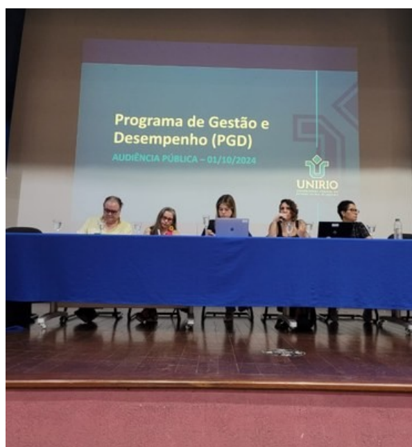
Audiência Pública sobre PGD