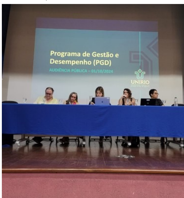
Mesa de abertura da audiência pública

Os palestrantes explicaram pontos importantes da normativa e responderam dúvidas dos servidores presentes. Esse modelo de gestão tem como objetivo disciplinar o desenvolvimento e a mensuração das atividades realizadas pelo servidor com foco na entrega por resultados e na qualidade dos serviços prestados à sociedade. Foi realizada a transmissão ao vivo pelo canal do Youtube da UNIRIO