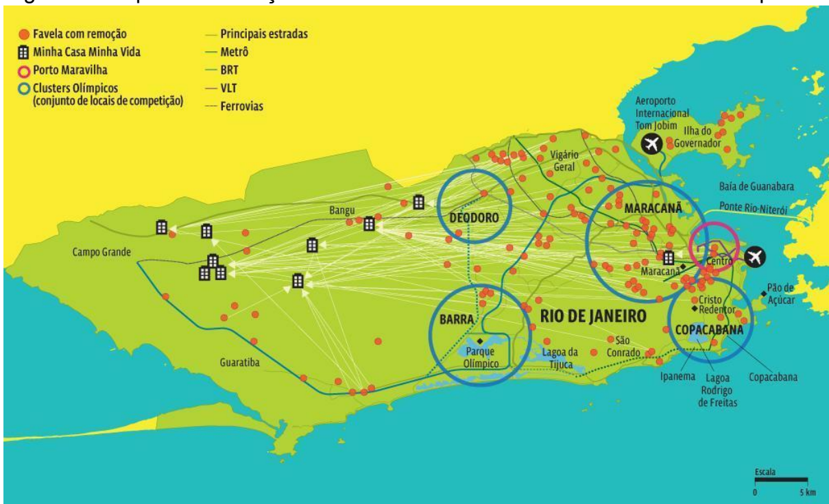
Figura 2 - Mapa das Remoções das Favelas no Período Antecedente às Olimpíadas