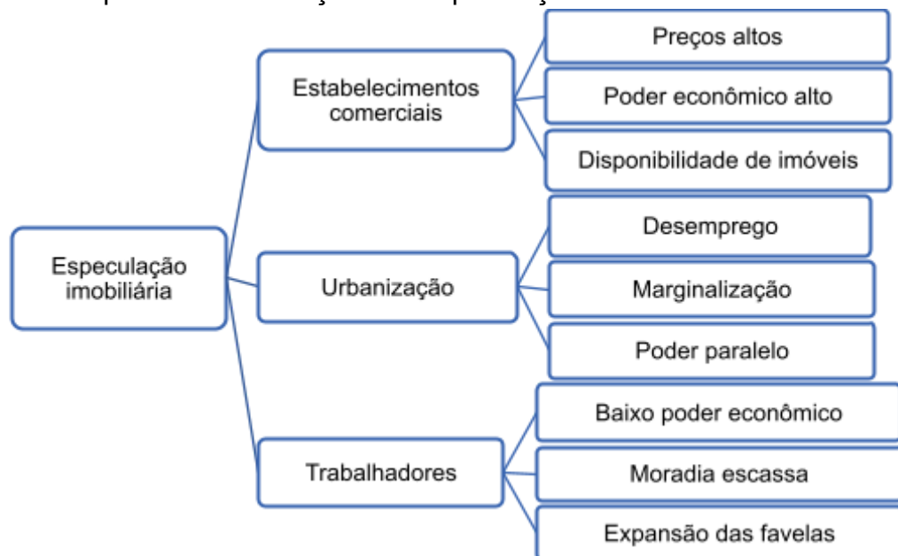
Figura 1 - Esquema de correlações da especulação imobiliária

Esse contexto se dá ainda nos dias de hoje, devido à centralização dos lucros nas áreas de maior valorização. Com isso, as famílias de menor poder aquisitivo sofrem pela banalização das suas subsistências, proibidas de escolher onde morar e de que forma viver. Ainda, sofrem pelo impacto social da não segurança, insalubridade, interrupção da educação e interferência na produção cultural, devido ao desenraizamento da diversidade social.