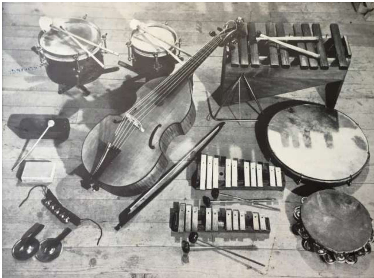
Figura 1. Instrumental Orff (Fonte: ORFF, C.; KEETMAN, G. Orff-Schulwerk. Música para crianças. I Pentatônico. Versão Portuguesa de Maria de Lourdes Martins. Mainz, B. Schott's Söhne, 1961, p.168).