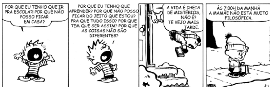
Figura 1 – Tirinha utilizada na aula com os alunos

Mais uma vez a turma ficou muito agitada. O aluno LA xingou a aluna K e começaram a discutir. Precisei intervir de forma dura, pois a professora havia se retirado da sala. Então, gritei para que o aluno sentasse, pois ele se levantou em direção à colega, aparentemente com a intenção de agredi-la. A turma tinha uma grande dificuldade para ouvir, existia uma necessidade de falar e isso dificultava que eles parassem para ouvir o outro, que esperassem o colega acabar de falar para falar e os conflitos eram constantes. Entreguei a seguinte tirinha do Calvin: