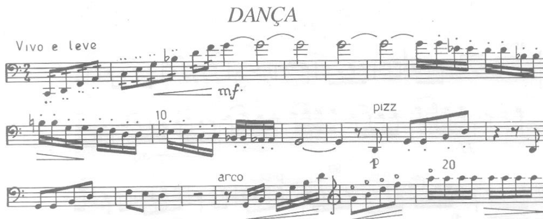
Figura 8. R. Gnatalli - Canção e Dança - para contrabaixo e piano - Trechos da peça.

É interessante ressaltar que esta foi a segunda peça escrita para contrabaixo, no Brasil. Nos 34 anos que se passou entre estas duas peças pioneiras, nenhuma outra obra foi composta para o contrabaixo no país. De acordo com Arzzola (1996,4), “até que se encontre o concerto de Leopoldo Miguez, a ‘ Canção e Dança ’ é a mais antiga peça brasileira para contrabaixo de que se tem conhecimento hoje, e também a mais idiomática”.