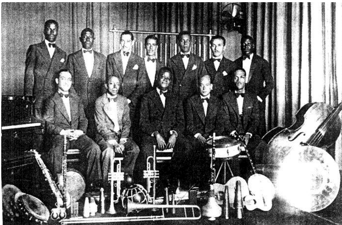
Figura 5. Grupo Diabos do Céu. Pixinguinha está sentado no centro. À sua direita o contrabaixista João Martins. 26

Segundo Aragão (2001,2), de 1929 a 1935 Pixinguinha foi contratado como arranjador pela gravadora Victor. E no período em que o maestro esteve à frente da Orquestra Victor como arranjador, as orquestras “eram formadas por um contingente grande de instrumentos de sopro: 2 ou 3 saxofones, 1 ou 2 trompetes e trombone, além da tuba que atuava na base harmônica”. Esta base “era formada geralmente por piano e/ou violão, banjo ou cavaquinho, tuba ou contrabaixo” (ARAGÃO,2001,45). No entanto, como já comentado, devido às limitações da gravação mecânica, alguns instrumentos de sonoridade fraca eram substituídos por outros, da mesma função, mas possuidores de potência sonora maior. Este foi o caso do contrabaixo. Durante a era da gravação mecânica, ou seja, as três primeiras décadas do século XX, este instrumento foi relegado a um plano secundário. Enquanto isso, a tuba ocupava o posto de instrumento baixo na maioria das gravações.