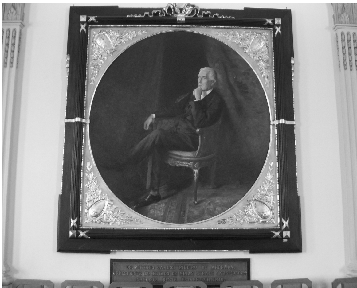
Foto: Retrato de Antônio Carlos R. de Andrada pintado por Boscaglia, que se encontra exposto no Salão Nobre do Instituto Estadual de Educação de Juiz de Fora – Sala Antônio Carlos. 144