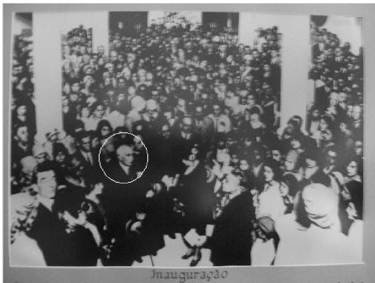
Foto de inauguração: O Senhor Presidente Antônio Carlos recebendo do engenheiro Lourenço Baeta Neves, consultor técnico de seu governo, o edifício da Escola Normal de Juiz de Fora, a 14 de agosto de 1930.