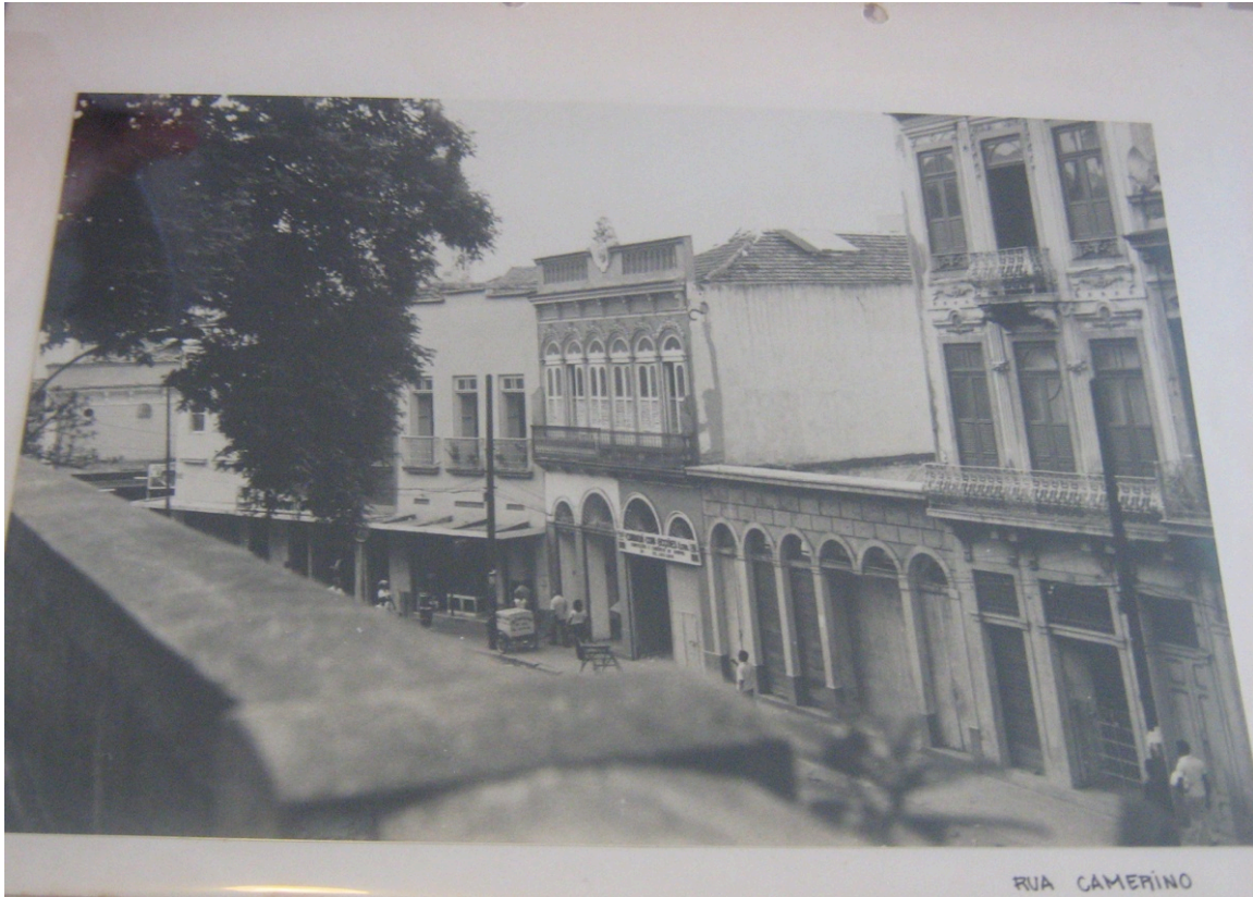
Figura V: Imagem que compõe o dossiê para o Projeto de Proteção e Revitalização para o Morro da Conceição e seus entornos da Rua Camerino.

Acompanhando este material, fotos da região foram dispostas de modo a complementar as informações que comporiam o desenvolvimento e conclusão do dossiê, como nota-se na foto abaixo: