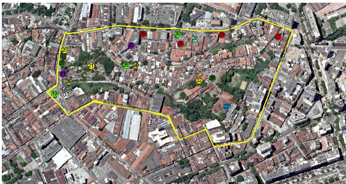
Figura I: Núcleo compreendido entre a Rua Sacadura Cabral, Camerino (trecho), Rua Senador Pompeu (trecho), da Conceição (trecho), Rua Leandro Martins, Rua Acre e Travessa do Liceu.