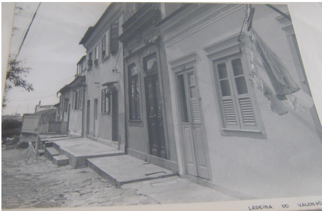
Figura V: Imagem da Ladeira do Valongo que compõe o dossiê para o Projeto de Proteção e Revitalização para o Morro da Conceição e seus entornos.

A partir desses dados foi possível apresentar os avanços e resultados preliminares do projeto, como é possível notar no trecho a seguir: