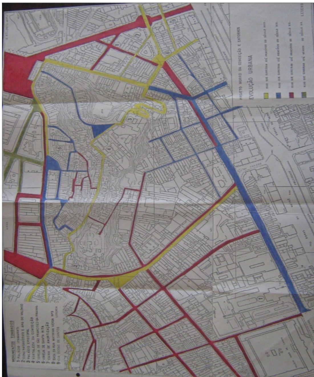
Figura IV: A imagem acima apresenta uma planta referente a evolução urbana da região do Morro da Conceição. A partir desse mapeamento foi possível notar a intensificação do processo de ocupação do local durante o início do século XX, como é apresentado na legenda: ruas que surgiram até princípios do século XVIII; ruas que surgiram até princípios do século XIX; ruas que surgiram até princípios do século XX; ruas que surgiram até meados do século XIX;