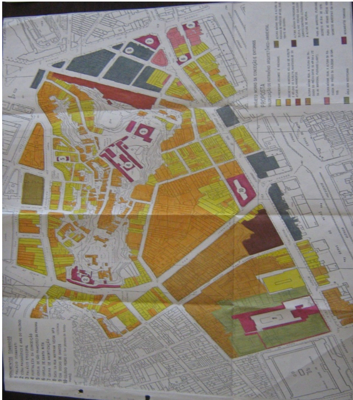
Figura III: A planta abaixo descreve as propostas de atuação definidas pelo Projeto, divididas em dez áreas distintas, a partir dos seguintes critérios: a preservar volumes e fachadas; decretos municipais nº 1541 de 4/05/78 e nº 1542 de 5/05/78, mantendo-se os atuais alinhamentos; altura máxima igual a altura da fachada do prédio entre nº 154 e 172 da Avenida Marechal Floriano (Light); Altura máxima igual a altura da fachada do prédio da Cia. Docas de Santos; Área non aedificandi; Altura máxima igual a altura da fachada do prédio nº 102, existente na quadra; Altura máxima da frontaria de 35,25m , não podendo qualquer elemento construído ultrapassar a altura de 44,5m; Para Av. Marechal Floriano – Decreto nº 1541 de 1978. Para as demais áreas ver Decretos Municipais em vigor; Monumentos tombados.