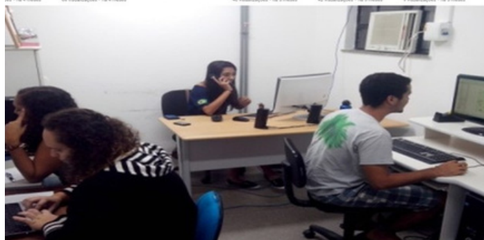
Tutoriais de Geoprocessamento no YouTube e uma visão do laboratório, com alguns alunos fazendo as suas pesquisas