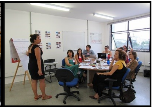
Workshop Inovação Social UNIRIO

de valor, enquanto a inovação social se direciona para a criação de valor. Na inovação tecnológica os produtos, processos, serviços são voltados ao ambiente produtivo, visando ao aumento de faturamento, acesso a novos mercados, aumento das margens de lucro, entre outros benefícios econômicos.