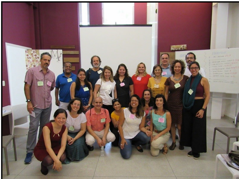
Encontro entre Mentores e responsáveis pelos projetos selecionados pelo I Ciclo de Mentores da UNIRIO

O que é a Rede Lasin? Como funciona essa parceria com a UNIRIO?