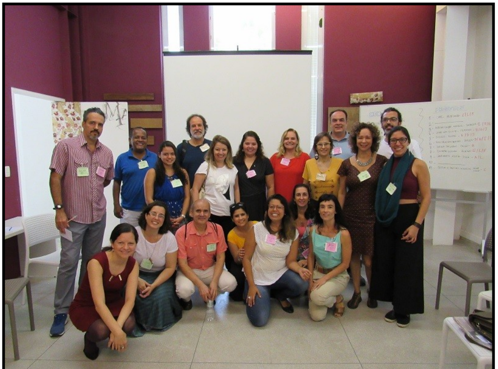
Encontro entre Mentores e responsáveis pelos projetos selecionados pelo I Ciclo de Mentores da UNIRIO

O que é a Rede Lasin? Como funciona essa parceria com a UNIRIO?