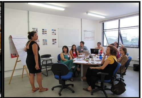
Workshop Inovação Social UNIRIO

tecnológica e inovação social. A inovação tecnológica aborda a apropriação de valor, enquanto a inovação social se direciona para a criação de valor. Na inovação tecnológica os produtos, processos, serviços são voltados ao ambiente produtivo, visando ao aumento de faturamento, acesso a novos mercados, aumento das margens de lucro, entre outros benefícios econômicos.