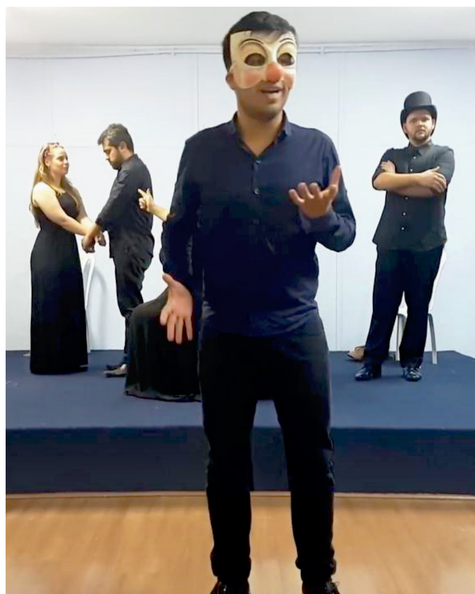
Apresentação no Centro Educacional em Niterói

“Em todas as apresentações que realizamos, o retorno é muito gratificante. O público se emociona, fica encantado. As pessoas têm fome de cultura. Isso está em uma das nossas raízes, a europeia. Não podemos deixar esse gênero musical acabar. A música encanta; basta assistir a um espetáculo e ver a reação da plateia”, finaliza a professora.