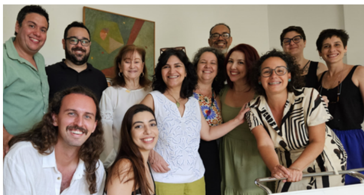
Parte dos pesquisadores reunidos para comemorar os êxitos do Laboratório em janeiro de 2025.