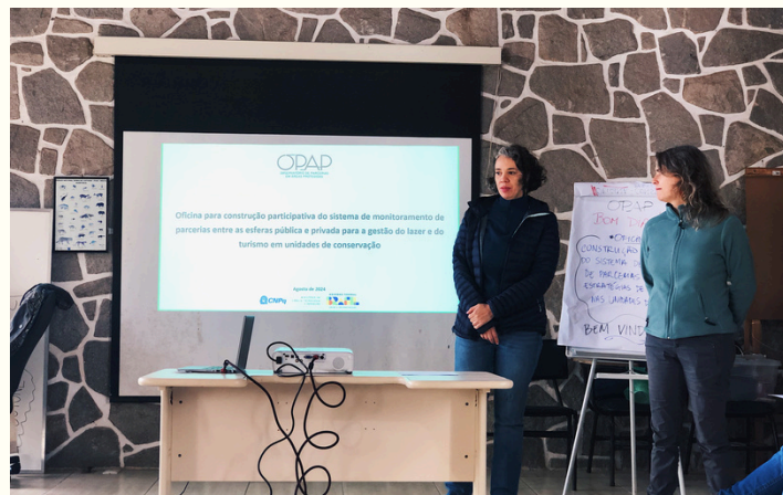
Oficina para construção da Matriz de Indicadores.

Entre as instituições participantes, destacam-se a Universidade de São Paulo, a Universidade do Estado do Rio de Janeiro, Universidade Federal Rural do Rio de Janeiro e a Universidade Federal de Juiz de Fora. A pesquisa conta também com parcerias que envolvem órgãos gestores estaduais, como o INEA e federais como o Instituto Chico Mendes de Conservação da Biodiversidade (ICMBio).