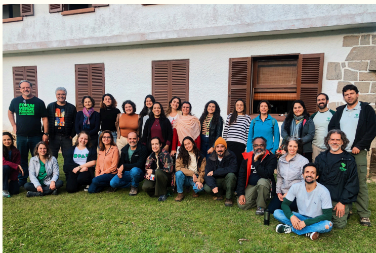
Equipe do OPAP, ICMBio e Inea reunidos para a oficina para construção da Matriz de Indicadores.

A equipe é composta por 13 professores e pesquisadores de 10 universidades de sete estados, além de estudantes de graduação e pós-graduação, com bolsas de iniciação científica.