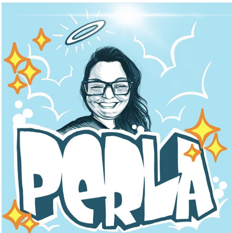
Arte por Marcelo Ment

Fazer uma homenagem para Perla é uma tarefa fácil e difícil ao mesmo tempo. Fácil porque Perla, ao longo de seus 11 anos de trabalho na UNIRIO, acumulou inúmeras amizades e foi muito simples reunir mensagens de carinho. Difícil, pois não foi fácil pensar em uma homenagem à altura da saudade que ela nos deixou.