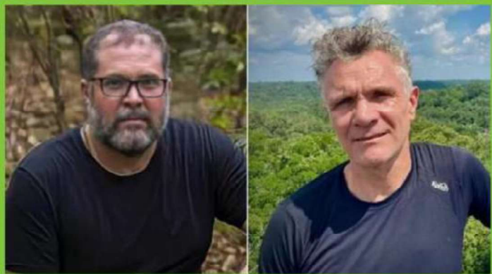
Bruno Araújo Pereira e Dom Phillips