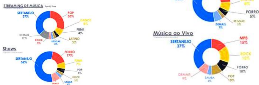
Gráfico 1 – Obras musicais por gênero e sua execução pública - 2019 fonte: Ecad 4

Apesar de todo o sucesso comercial, o aprendizado se baseia ainda na tradição oral, que acontece principalmente por meio da escuta e observação de outros músicos: