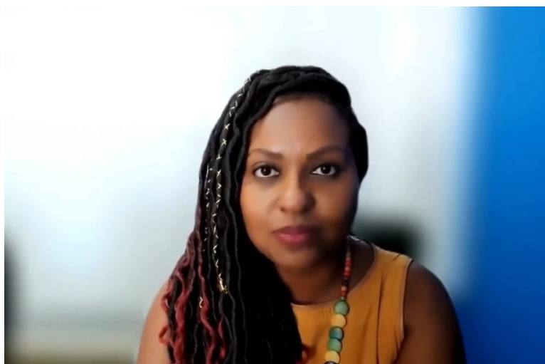
Vídeo sobre desenvolvimento de pessoas com a participação da Diretora da DDP, da PROGEPE

105 homens ocupam cargos de chefia na UNIRIO (24 técnicos, 77 Professores e 4 cargos comissionado não servidores) 38 homens ocupam CD; 38 homens ocupam FG e 29 homens ocupam FCC