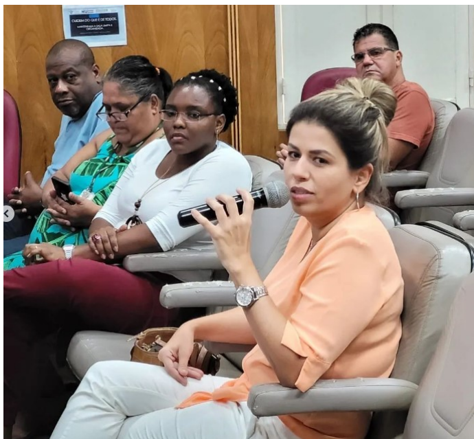
Participação da plateia durante o evento.