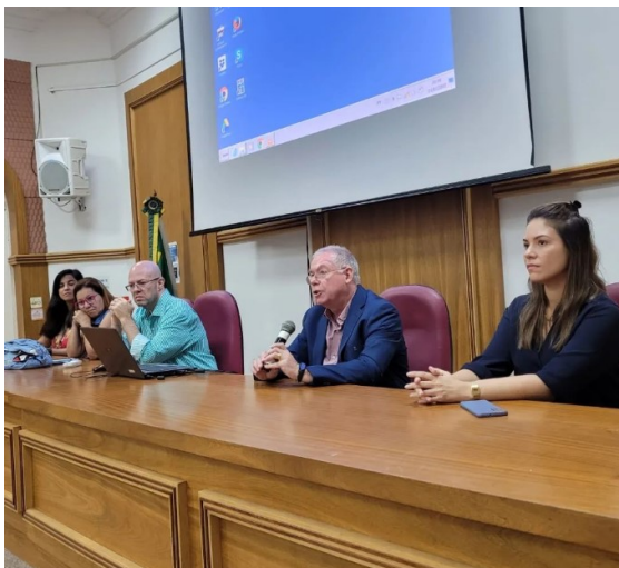
Mesa de abertura do evento em homenagem ao mês da Mulher no HUGG com a presença da Asunirio, Adunirio, Superintendência do HUGG, Reitoria e PROGEPE