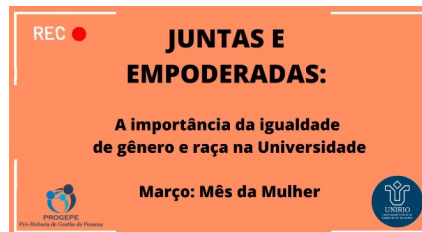
Vídeo apresentado no evento em homenagem ao mês da Mulher no HUGG