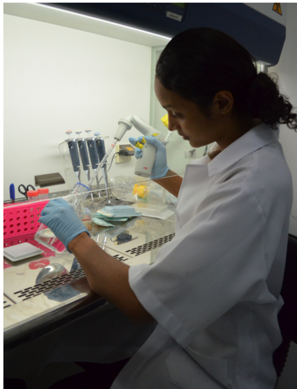
Equipe do LBE inclui alunos de graduação e mestrado

Defensor de mais políticas de incentivo à pesquisa básica no Brasil, o cientista considera essa uma área de difícil atuação. “Atualmente, não há no país nenhuma lei de incentivo à ciência voltada especificamente para a pesquisa básica”, aponta. Segundo ele, embora sirvam como fundamento para outras modalidades científicas, projetos de pesquisa básica são geralmente desprestigiados em detrimento de estudos de aplicabilidade imediata.