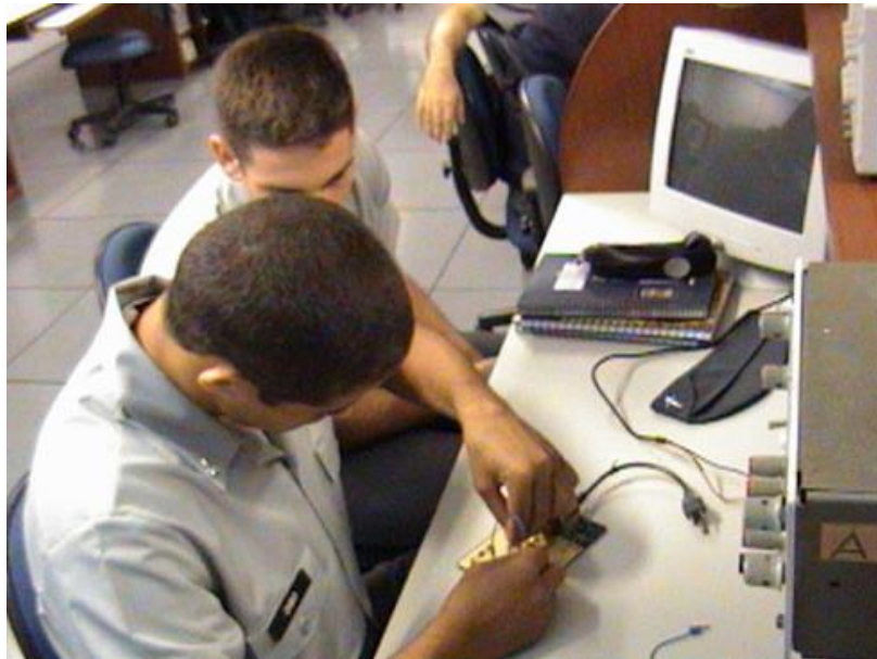
IMAGEM 7 - Laboratório de Eletrônica da Escola Naval.

No laboratório de Eletrônica são realizadas as aulas práticas das disciplinas ligadas à eletrônica, no qual os Aspirantes podem aplicar os conhecimentos construídos nas aulas teóricas.