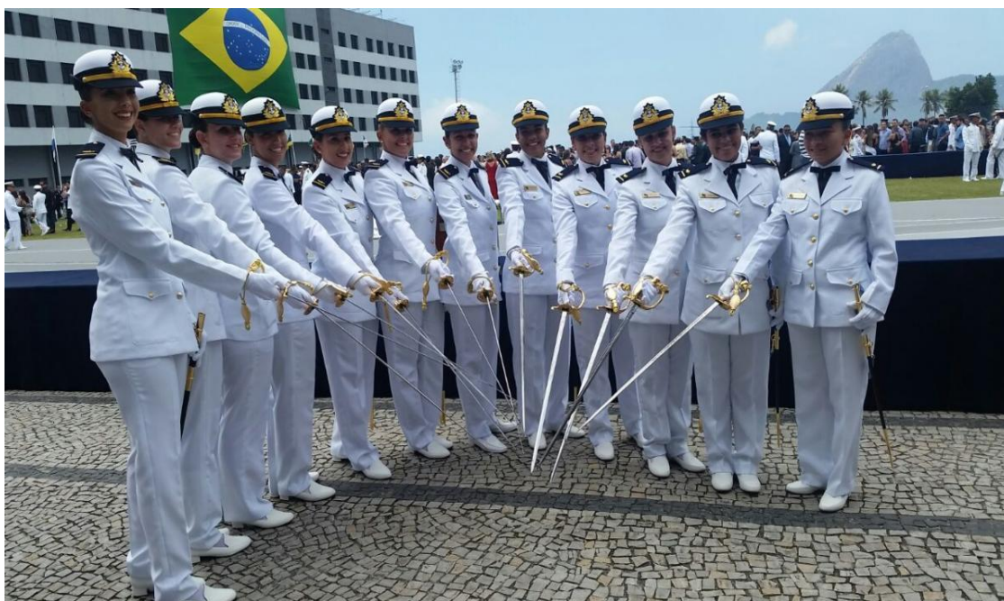
IMAGEM 22: As Guardas-Marinha Intendentes da primeira turma de mulheres da Escola Naval.

A imagem abaixo foi registrada no dia da formatura, após a Cerimônia de Declaração de Guardas-Marinha ocorrida na Escola Naval.