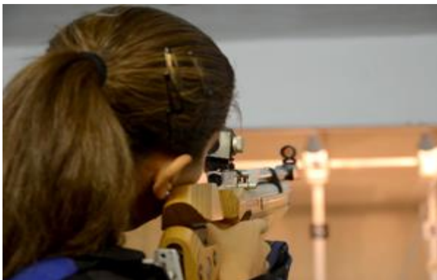
IMAGEM 17 – Aspirante feminina praticando tiro esportivo

A Asp. 7, durante a entrevista, mencionou que sua maior dificuldade foi o período de Adaptação, pois exigiu atividades físicas e militares que não são comuns no meio civil, mas que essa dificuldade foi superada e em nenhum momento pensou em desistir por esse motivo. Para ela, além das dificuldades inerentes a parte acadêmica do curso, esse período foi cheio de novidades e desafios: