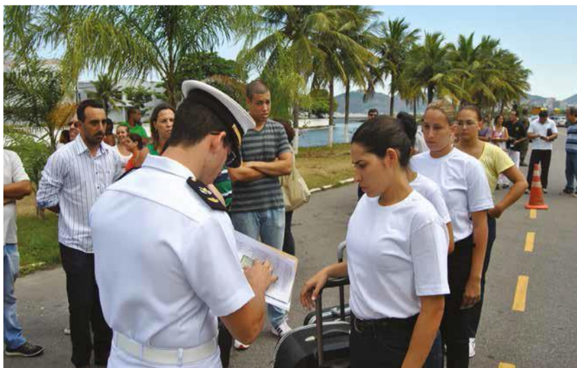
IMAGEM 15 - Apresentação das Aspirantes da primeira turma na Escola Naval para o Período de Adaptação 82

Adaptação o uniforme utilizado é composto por calça jeans, camiseta, tênis e boné brancos e cinto preto.