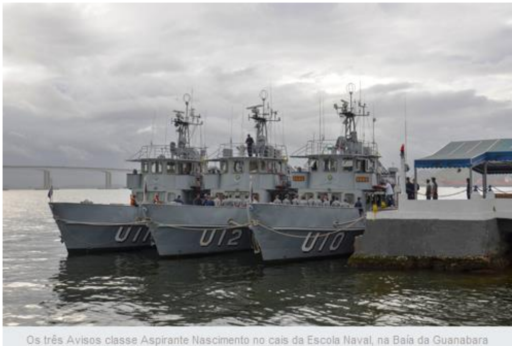
IMAGEM 4 - Avisos de Instrução da Escola Naval.

Os Simuladores dos Avisos de Instrução são simuladores de navios que reproduzem situações que podem ocorrer em um Passadiço de um navio, local no qual o Oficial da Armada conduz a sua embarcação em alto mar durante a navegação. Cabe destacar que são denominados Avisos de Instrução os navios de pequeno porte com equipamentos reais utilizadas pelos Aspirantes sob a Supervisão de profissionais responsáveis com a finalidade didática de realizar embarques, viagens e aulas práticas e teóricas sobre disciplinas específicas, como às relacionadas à Navegação.