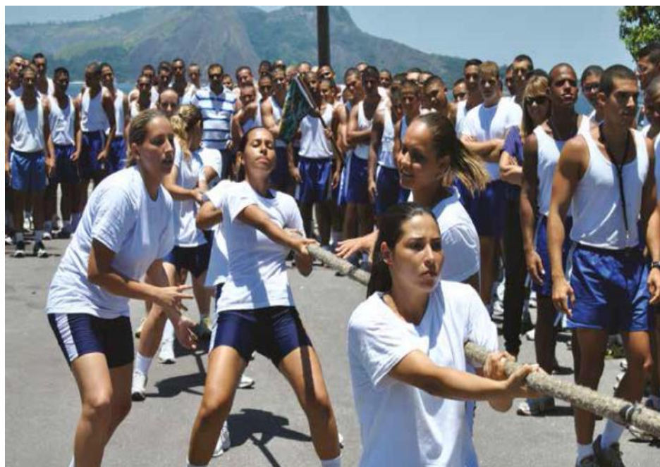
IMAGEM 19 – Aspirantes femininas praticam esporte de Cabo de Guerra na Escola Naval

Após o término do Período de Adaptação, finalmente as alunas permaneceram na Escola Naval como Aspirantes da primeira turma do Curso de Graduação para Oficiais, do Corpo de Intendentes da Marinha, da habilitação Administração e iniciaram ao Ciclo Escolar do curso, composto por quatro anos letivos.