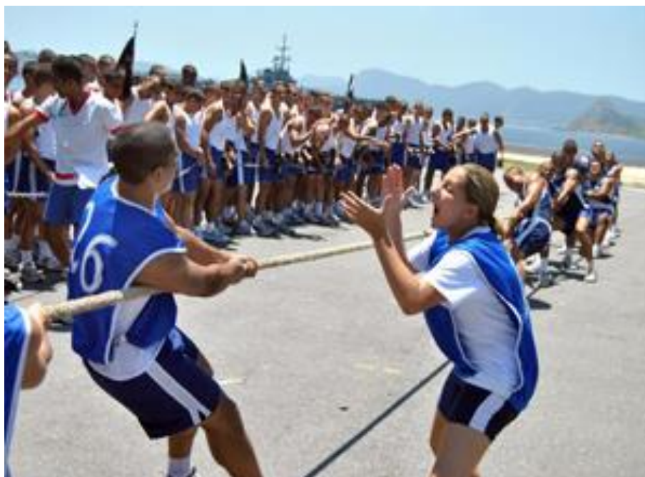
IMAGEM 18 - Aspirantes praticam esporte de Cabo de Guerra na Escola Naval

O TFM é uma disciplina denominada Treinamento Físico Militar, na qual são desenvolvidas diversas atividades físicas, principalmente corrida e natação. Apesar desses momentos de dificuldades, comuns por ocasião do período de Adaptação à vida militar ainda como uma etapa do processo seletivo, durante uma das entrevistas tive a oportunidade de ouvir um relato emocionado dessa mesma Aspirante ao explicar sua satisfação em fazer parte da história da primeira turma: