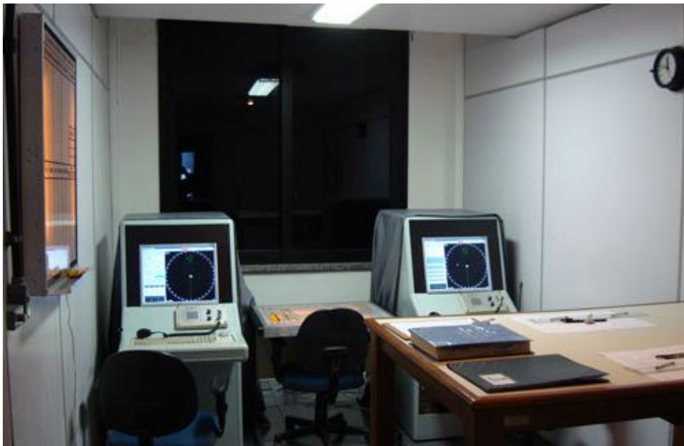
IMAGEM 6 - Simulador Tático da Escola Naval.

O Simulador Tático desenvolve situações semelhantes às desenvolvidas a bordo de navios, instalado em um compartimento físico nas instalações da Escola Naval.