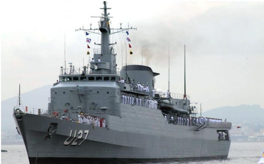
IMAGEM 10 - Navio Escola Brasil.

Após a conclusão dos quatro anos do Ciclo Escolar, os Aspirantes são declarados Guardas-Marinha 37 em Cerimônia Militar solene e iniciam o Ciclo Pós Escolar, o qual possui três fases, com suas disciplinas discriminadas conforme abaixo. Nota-se que as disciplinas da primeira fase são comuns aos três Corpos, enquanto as disciplinas da segunda e terceira fases são específicas para cada Corpo.