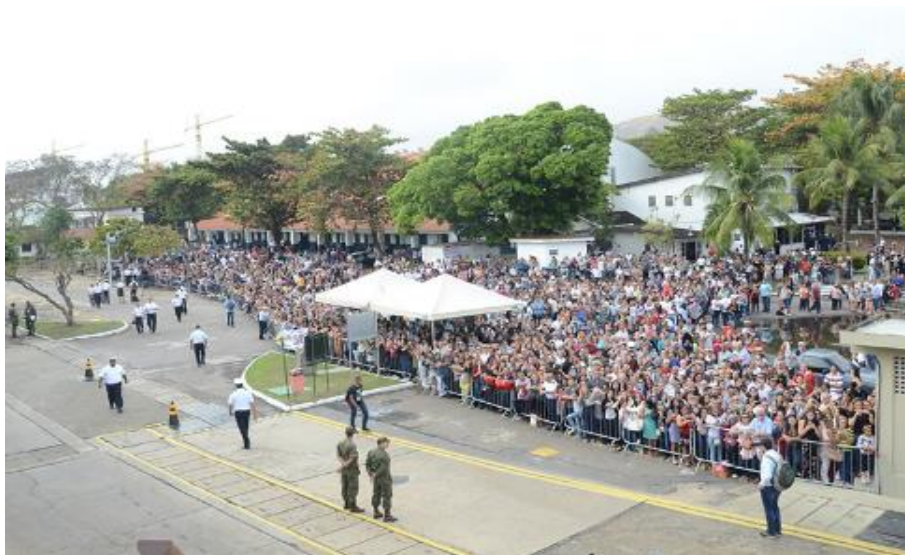
IMAGEM 25 - Familiares e amigos que se reuniram na Base Naval do Rio de Janeiro para se despedir dos Guardas-Marinha da Turma Almirante Gastão Motta.

No dia 22 de julho de 2018, o Navio-Escola Brasil suspendeu da Base Naval do Rio de Janeiro para dar início à XXXII Viagem de Instrução de Guardas-Marinha (VIGM), a primeira viagem de instrução a ser realizada com a presença de Guardas-Marinha do sexo feminino. A Imagem a seguir registra a presença dos familiares e amigos da tripulação que fará parte da comissão, dentre eles, os das Guardas-Marinha Intendentes.