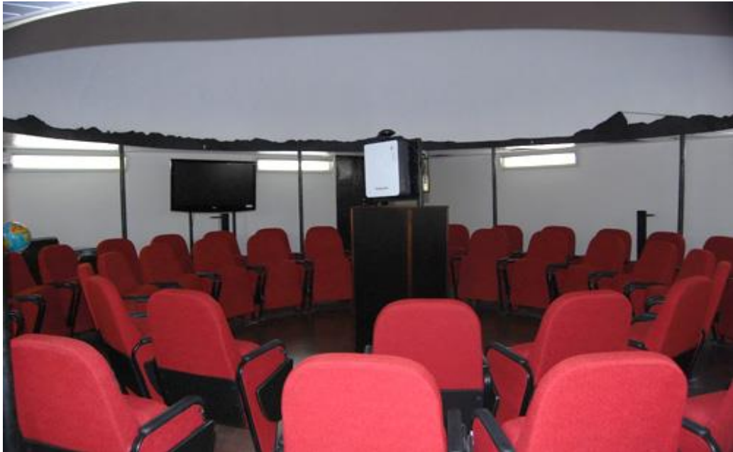
IMAGEM 5 - Planetário da Escola Naval.

O Simulador Tático desenvolve situações semelhantes às desenvolvidas a bordo de navios, instalado em um compartimento físico nas instalações da Escola Naval.