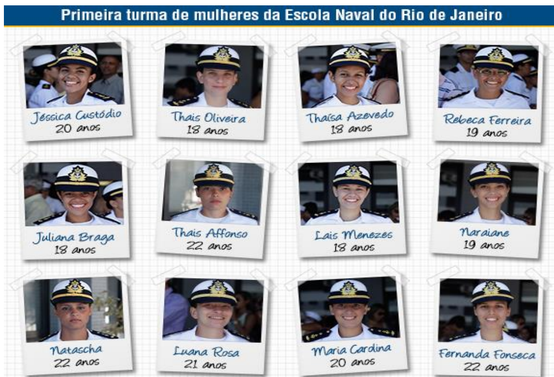
IMAGEM 14 - As 12 Aspirantes da primeira turma da Escola Naval.

As idades médias entre 18 e 22 anos também são semelhantes à média de idade de ingresso dos estudantes egressos do Ensino Médio nas diversas universidades do país 78 para cursar sua graduação. Lembrando que o edital do concurso público estabelecia limites de idade entre 18 a 23 anos.