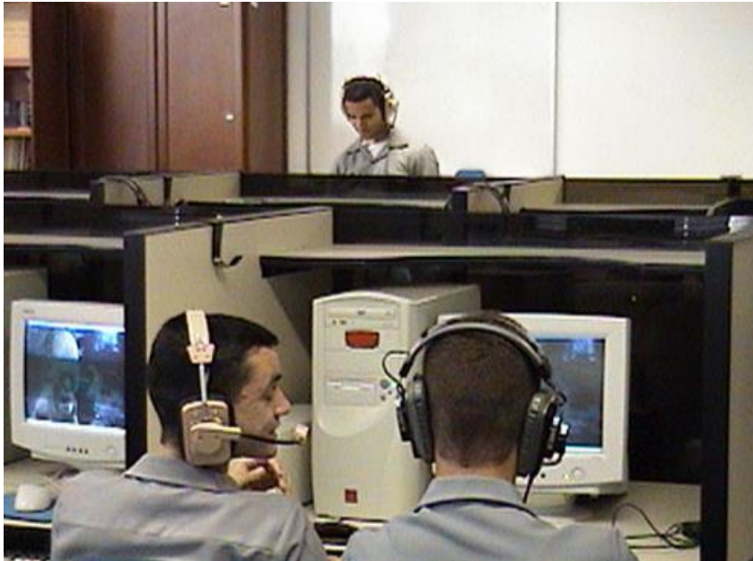
IMAGEM 9 - Laboratório de Línguas da Escola Naval.

Nas imagens apresentadas dos laboratórios, nota-se apenas a presença masculina, denotando a ausência da figura feminina, por se tratar de laboratórios utilizados predominantemente nas aulas destinadas aos Aspirantes do Corpo da Armada e do Corpo de Fuzileiros Navais, nos quais ainda não há a presença de Aspirantes mulheres. Realidade que poderá ser modificada a partir de 2019, devido a possibilidade de ingresso de mulheres nesses Corpos, além do Corpo de Intendentes.