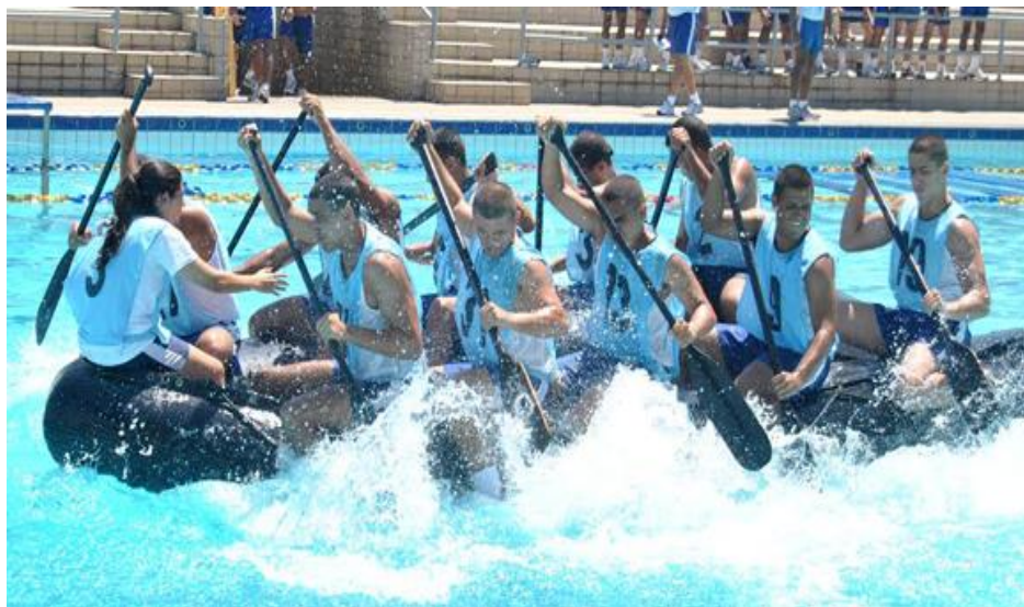
IMAGEM 20 - Aspirantes praticam atividade de esporte a Remo na Escola Naval

Em face do acima exposto, após o destaque e análise dos aspectos relacionados ao ingresso da primeira turma das Aspirantes no Curso de Graduação da Escola Naval em 2014, a partir da aprovação em todas as etapas do concurso público e da conclusão da fase do período de Adaptação, conquistam a permanência na Escola Naval, quando são matriculadas como Aspirantes do Curso de Graduação para Oficiais da Escola Naval, do Corpo de Intendentes da Marinha, da habilitação administração, o que será tratado no capítulo seguinte.