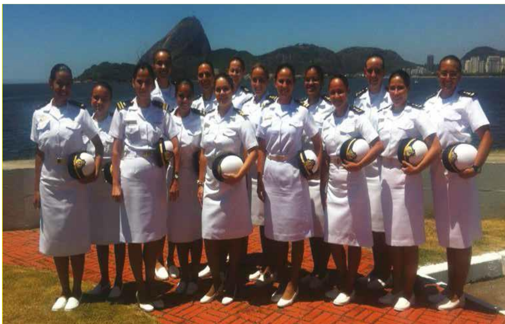
IMAGEM 21 - As novas Aspirantes posam para a foto junto a Oficiais femininas da Escola Naval 87

A imagem a seguir registra as Aspirantes da primeira turma vestidas com o uniforme denominado 5.5 86 , do grupo branco de verão, que é utilizado em ocasiões especiais, ao lado das Oficiais femininas da Escola Naval. O cenário da foto é a própria Escola Naval. Os cabelos, e barba no caso dos homens, também devem estar nos padrões determinados pela Marinha, para as mulheres com cabelos longos, o penteado deverá ser em formato de coque.