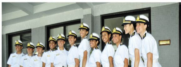
IMAGEM 27 - Extrato da reportagem sobre o ingresso pela primeira vez de mulheres na Marinha na linha de combate.

Com a novidade, a partir de 2019, as mulheres poderão fazer parte da atuação operativa da Marinha do Brasil, indo ao combate junto com o pelotão em operações em terra e exercendo funções como servir a bordo de navios, além de conhecer outros portos e países.