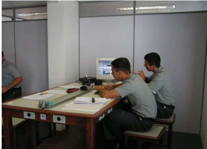
IMAGEM 8 - Laboratório de Física da Escola Naval.

O Laboratório de Física tem o objetivo de melhorar o processo de ensino aprendizagem por meio da experimentação e demonstração dos princípios da Física, contribuindo para motivar o interesse dos alunos por meio de ferramentas que colaboram na construção do conhecimento.