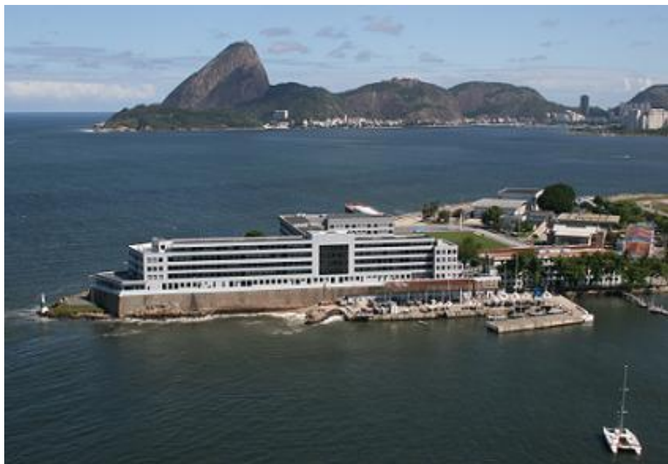
IMAGEM 3 - Escola Naval, situada na Ilha de Villegagnon.

A Escola Naval se localizou inicialmente sobre as instalações precárias, quase todas demolidas devido a tiros durante a Revolta da Armada, da antiga fortaleza de Nossa Senhora da Conceição de Villegagnon, na qual foram construídos novos prédios, especialmente para receber as turmas de Aspirantes em 1938. Local considerado até o tempo presente como o seu porto seguro, como ilustrado na imagem abaixo.