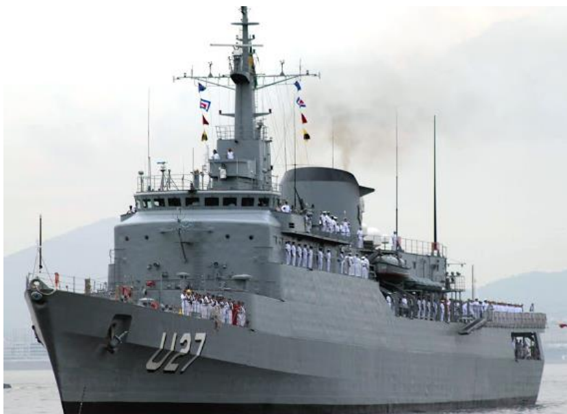
IMAGEM 26 - Navio Escola Brasil suspende para a XXXII Viagem de Instrução de Guardas-Marinha da Turma Almirante Gastão Motta.

Londres (Inglaterra), Hamburgo (Alemanha), Baltimore e Miami (Estados Unidos da América) e Cartagena (Colômbia)”. 100