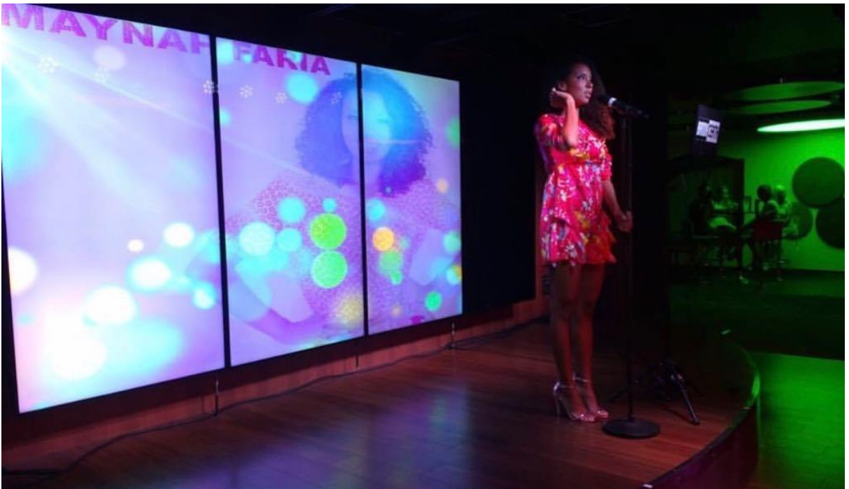
Figurino especial para set solo e Live Room.