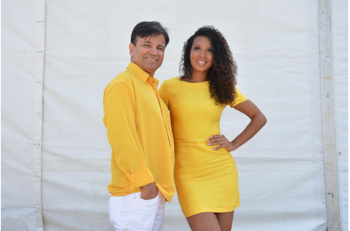
Combinação de cores entre integrantes da Banda