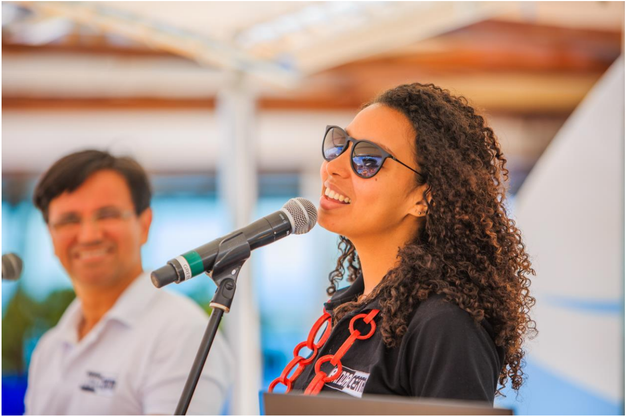
Combinação com preto e branco (cores oficiais da banda) para evento na piscina.