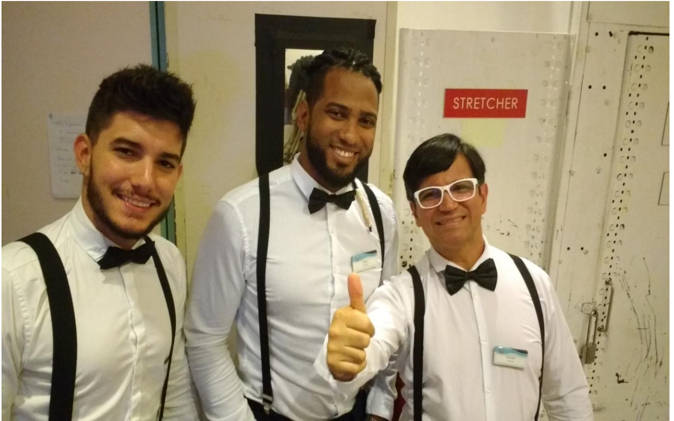
Figurino para show temático dos Beatles.