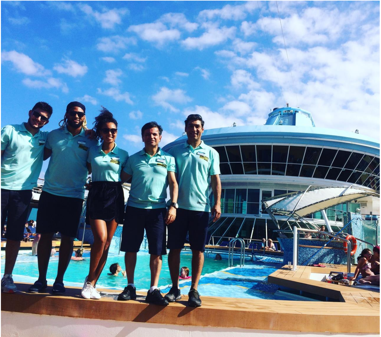
Uniforme usado para eventos durante o dia na piscina