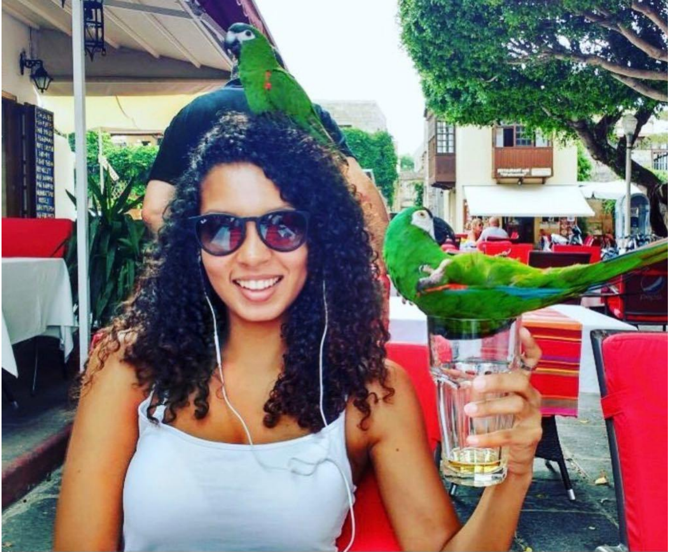
Grécia – Rhodes