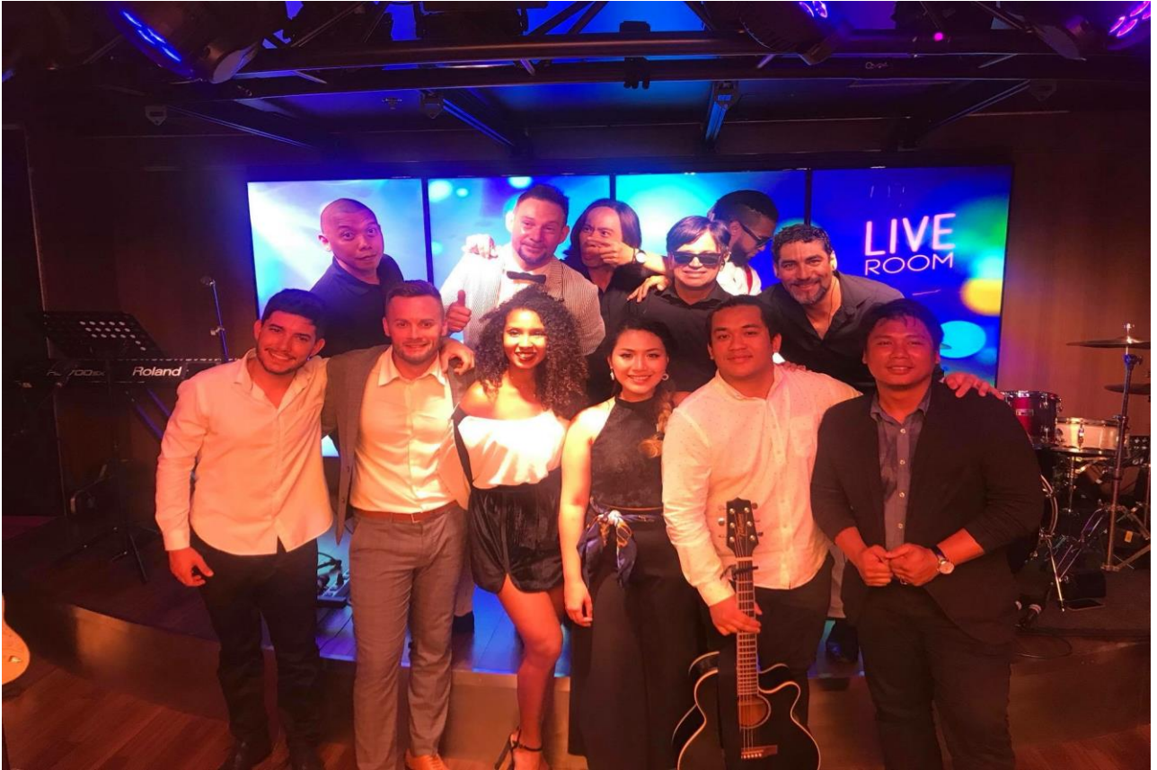
Músicos a bordo aderiram à nossa escolha de cores.