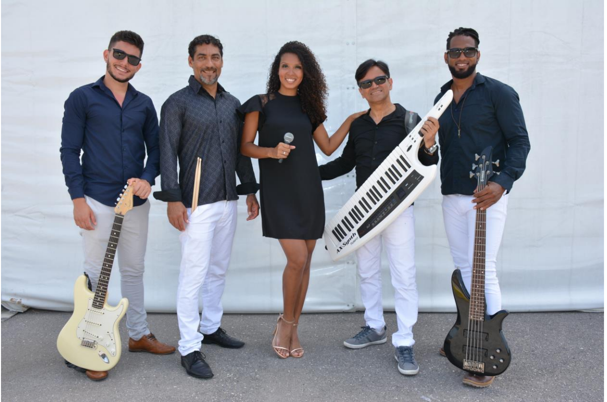
Combinação de cores entre integrantes da Banda