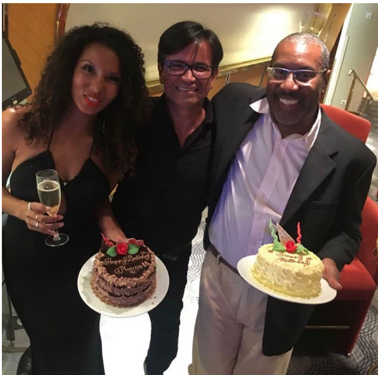
Comemoração do meu aniversário