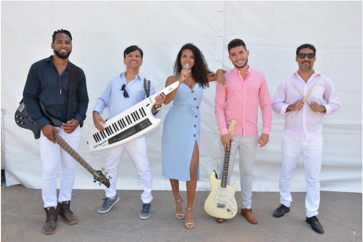
Combinação de cores entre integrantes da Banda