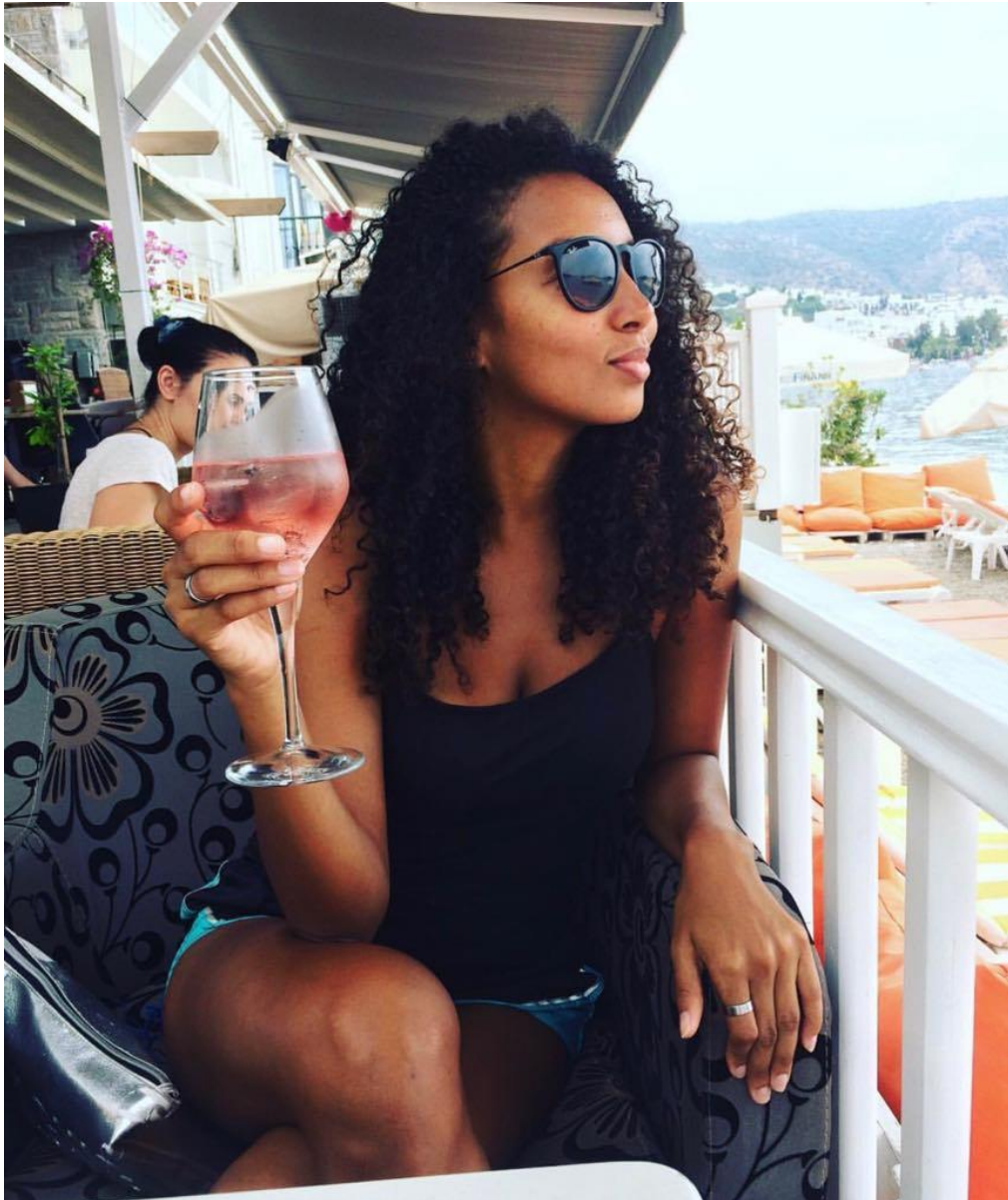
Turquia - Bodrum