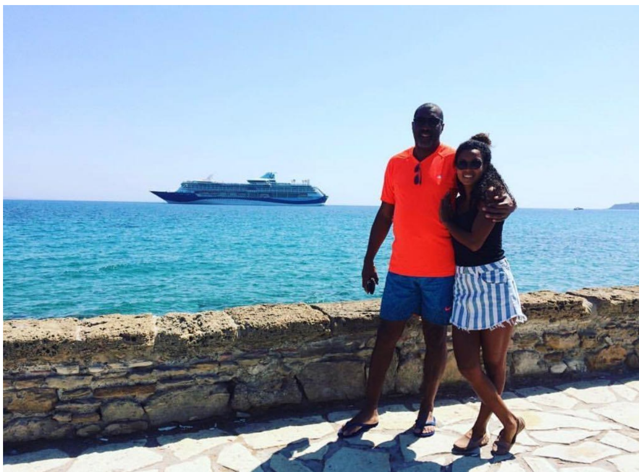
Turquia Grécia - Zakynthos