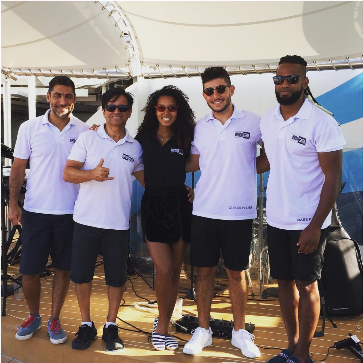
Uniforme usado para eventos durante o dia na piscina