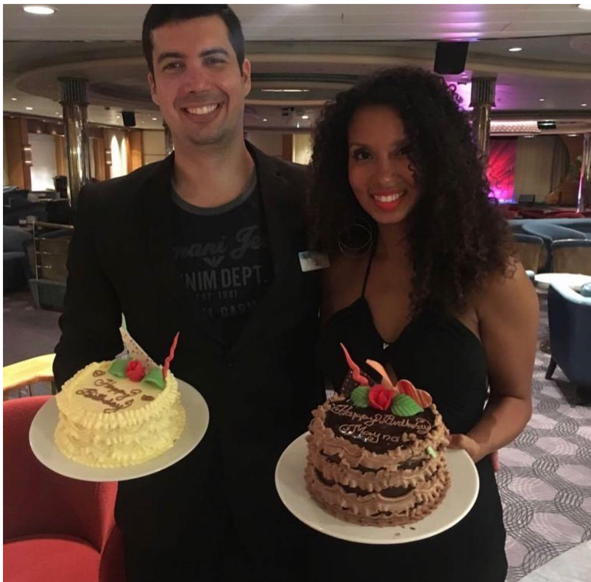
Amigo que me presenteou com um bolo.