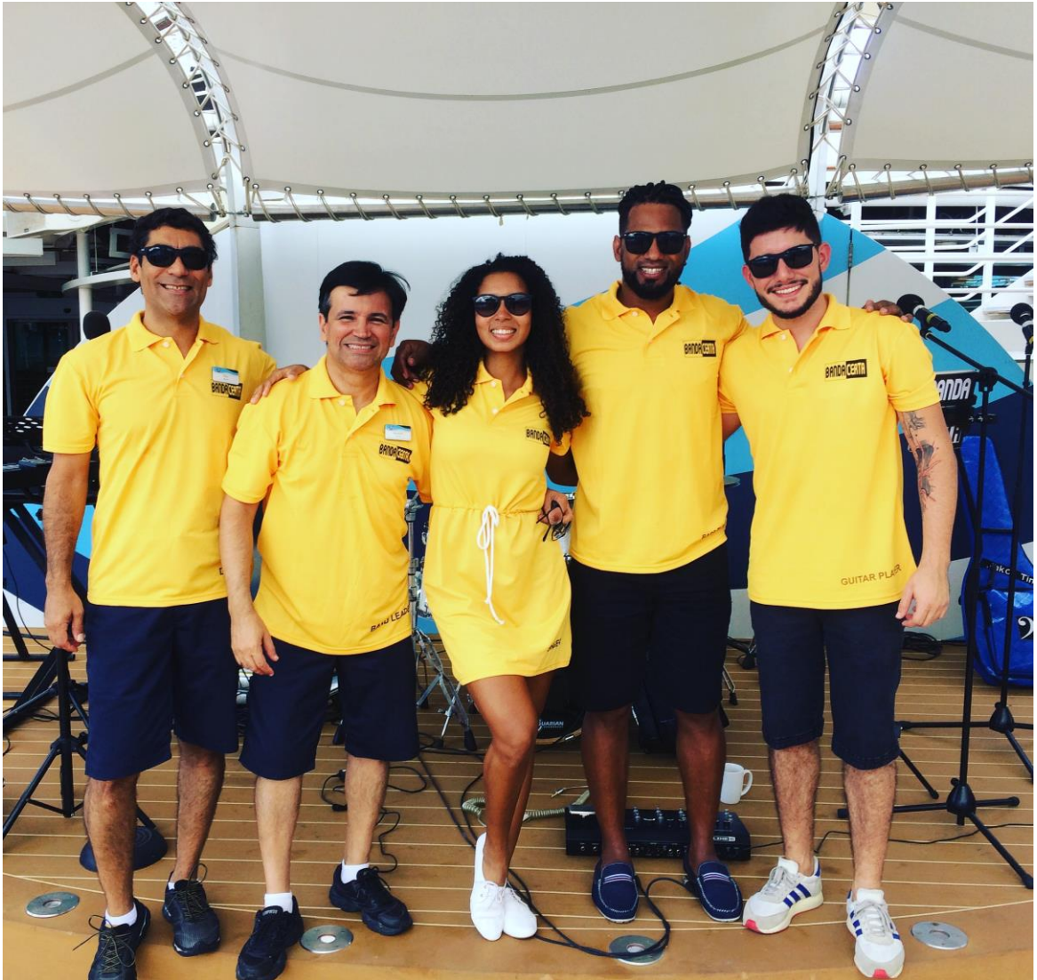
Uniforme usado para eventos durante o dia na piscina