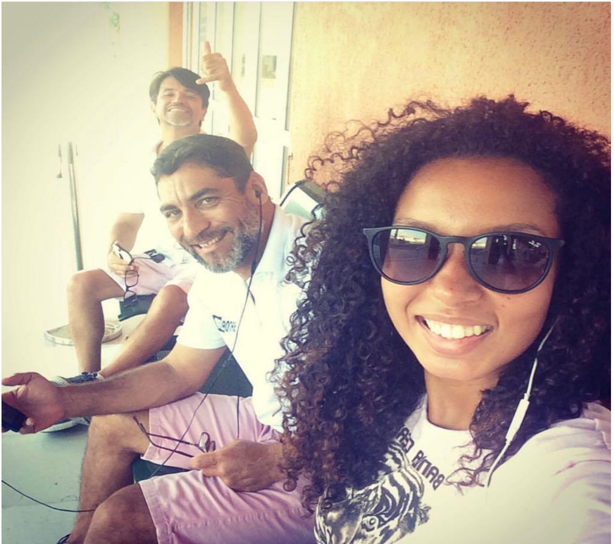
Uniforme de combinação Branca e Rosa, usados em momento de descontração após evento na piscina.