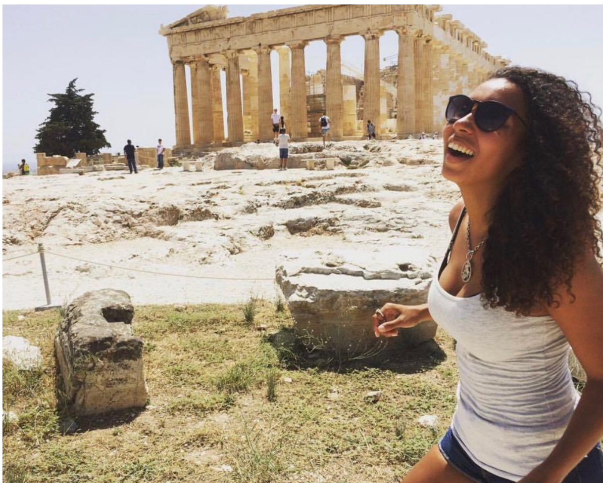
Grécia – Atenas