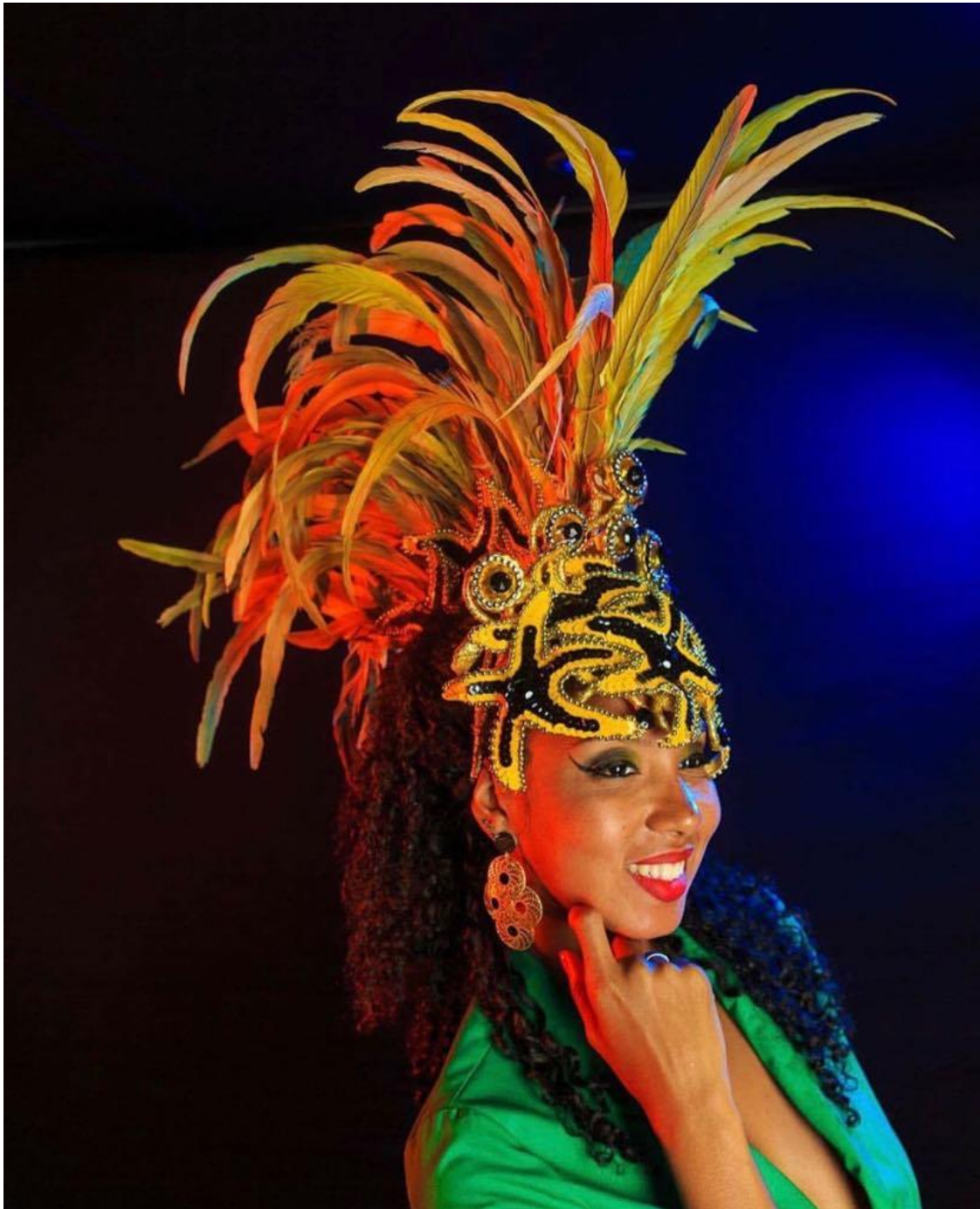
Foto com Cabeça específica para sets de carnaval