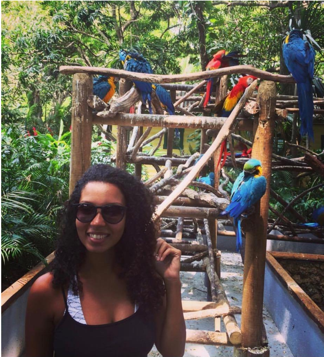
Cartagena das Índias – Colômbia