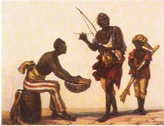
Escravo Tocando Berimbau DEBRET, Jean-Baptiste. Voyage pittoresque et historique au Brésil Paris: Didot Firmin et Frères, 1824.