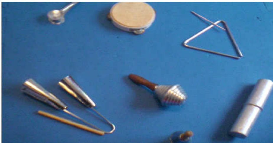
Fig.2 – Exemplos de idiofonos (triângulo, sino, ganzá, etc.)

Os xilofones e metalofones 2 (lâminas de madeira ou metal dispostas sobre uma caixa de ressonância e percutidas com baquetas), são denominados por Brito (2003) como idiofonos que possuem altura determinada, ou seja, uma afinação, e são capazes de reproduzir as notas musicais, ao contrário dos idiofonos citados anteriormente.