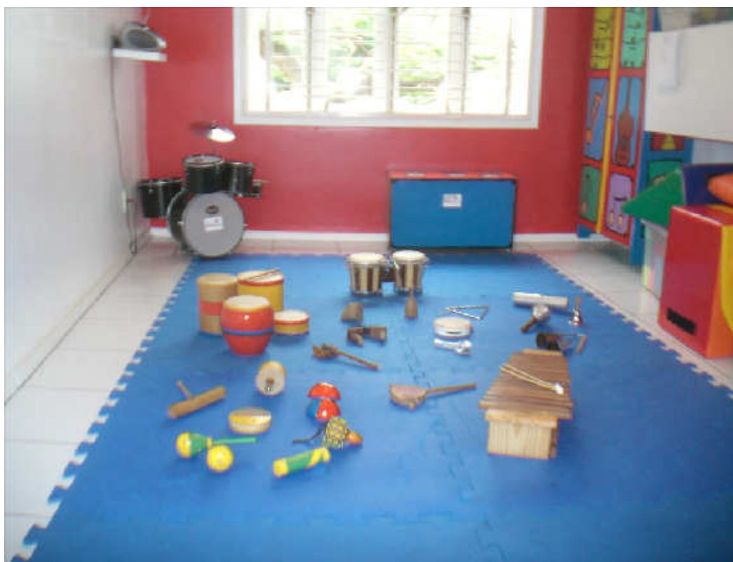
Fig.7 – Foto tirada no Espaço.

A instituição ainda é pequena, mas com ótima estrutura, ambiente adaptado para as crianças, instrumentos de percussão diversos, acervo de literatura infantil, instrumentos de sopro e cordas, e muitos brinquedos educativos.