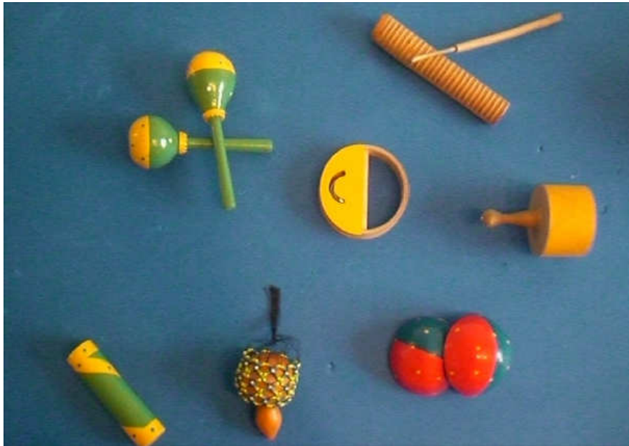
Fig.1 – Exemplos de idiofonos (chocalho, coquinho, reco-reco, etc.)