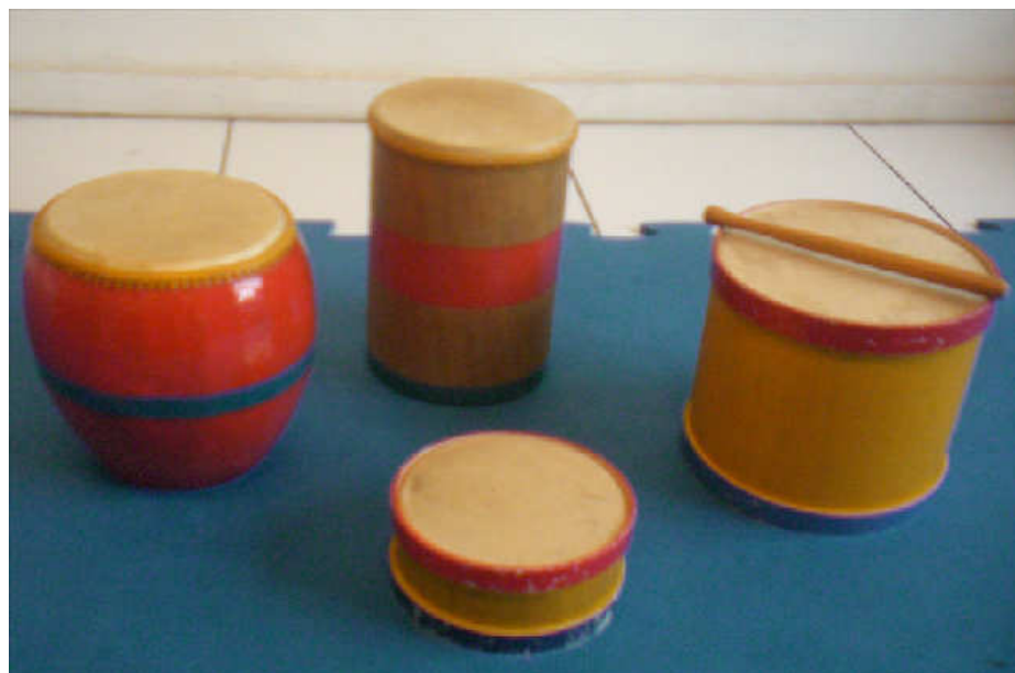
Fig.4 – Variedade de tambores

“Os tambores, que são instrumentos muito primitivos, dotados de função sagrada e ritual para muitos povos, exercem enorme atração sobre as crianças. Existe uma grande variedade de tambores e instrumentos de peles” (Brito, 2003, p.65).