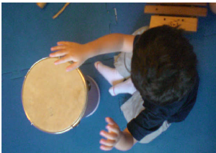
Fig. 8 – Aula de Iniciação Musical, momento em que ocorre a prática de conjunto.

Esta faixa etária na qual trabalho - entre 2 e 5 anos - correspondem à 2ª etapa das atividades, que se subdividem em outras 2 etapas: Música e Movimento – de 2 a 4 anos; e Iniciação Musical – de 4 a 6 anos. As turmas consistem de, no máximo, 6 crianças, o que possibilita um atendimento personalizado e individualizado.