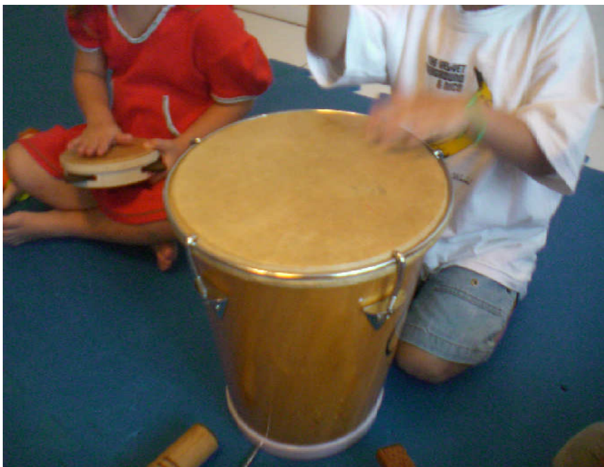
Fig. 9 – Alunos do Espaço na aula de Iniciação Musical

A outra etapa do trabalho, Iniciação Musical tem como foco a teoria musical. São utilizados jogos, ilustrações, vivências práticas, leituras de livros, além da prática de conjunto e de cantoria. O repertório é composto por músicas que fizeram a história da MPB, passeando por diversos ritmos como lundu, marchinha, bossa-nova, rock, entre outros.