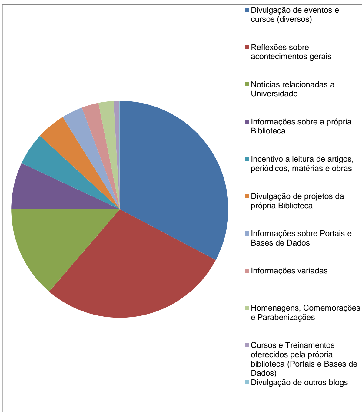
Gráfico 2 – Proporção dos posts por categoria (2013-2014 e 2014-2015)