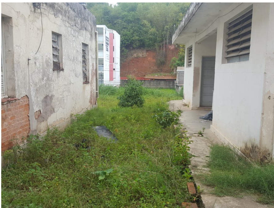
Fundos do terreno da Av. Rio Branco, 3460 – Juiz de Fora – MG.