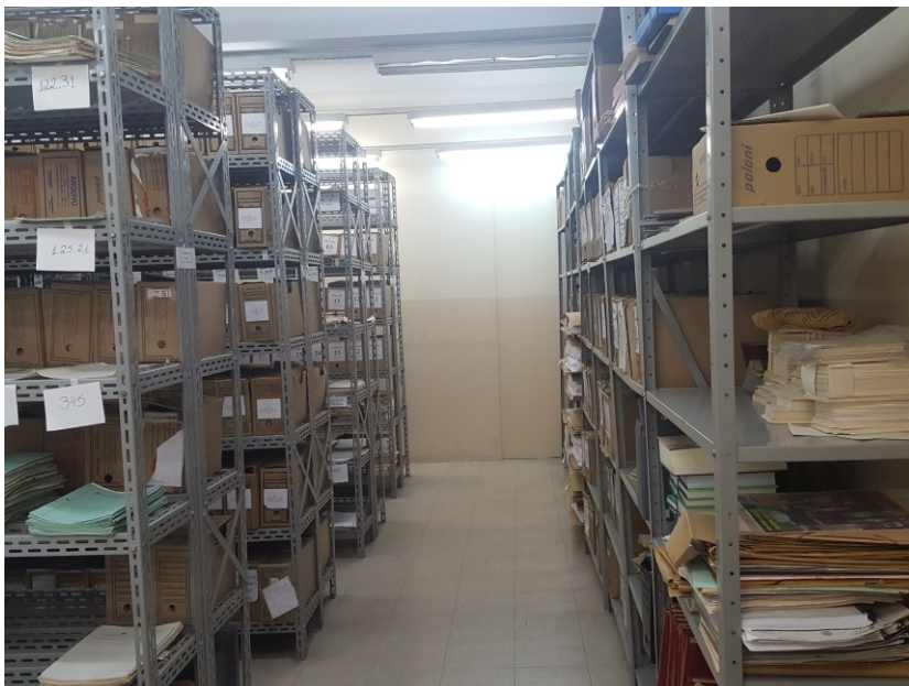
Arquivo Permanente da UFJF Crédito: Alessandra de Carvalho Germano