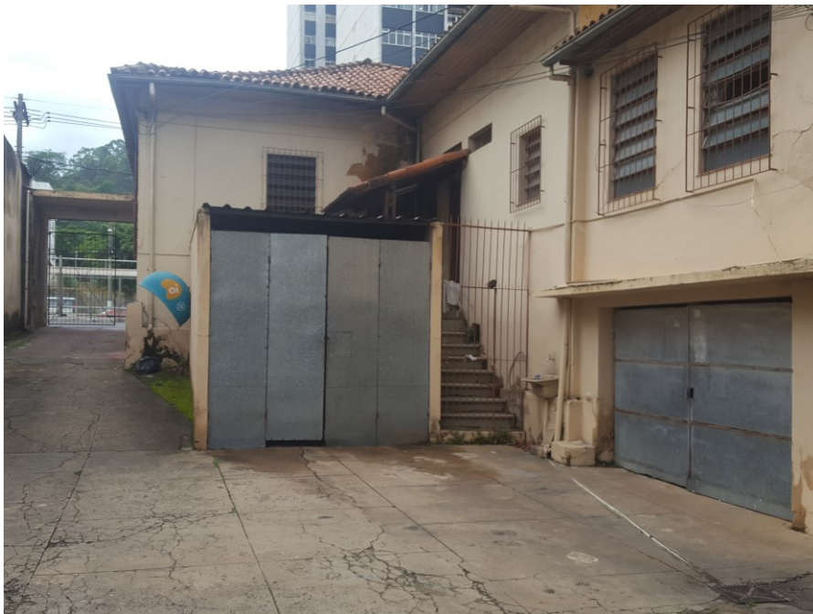
Vista da porta do Prédio da Coordenação de Arquivos Permanentes para a Av. Rio Branco.