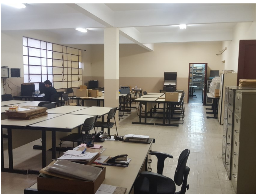
Secretaria do Arquivo Central e Sala de Consulta da Coordenação de Arquivos Permanentes da UFJF