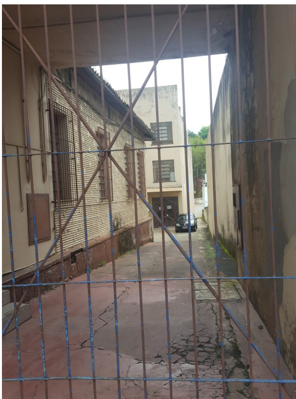
Entrada para o prédio da Coordenação de Arquivos Permanentes da UFJF. (Prédio situado ao fundo da fotografia.)