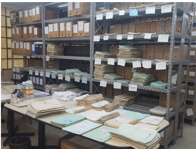
Arquivo Permanente da UFJF Crédito: Alessandra de Carvalho Germano