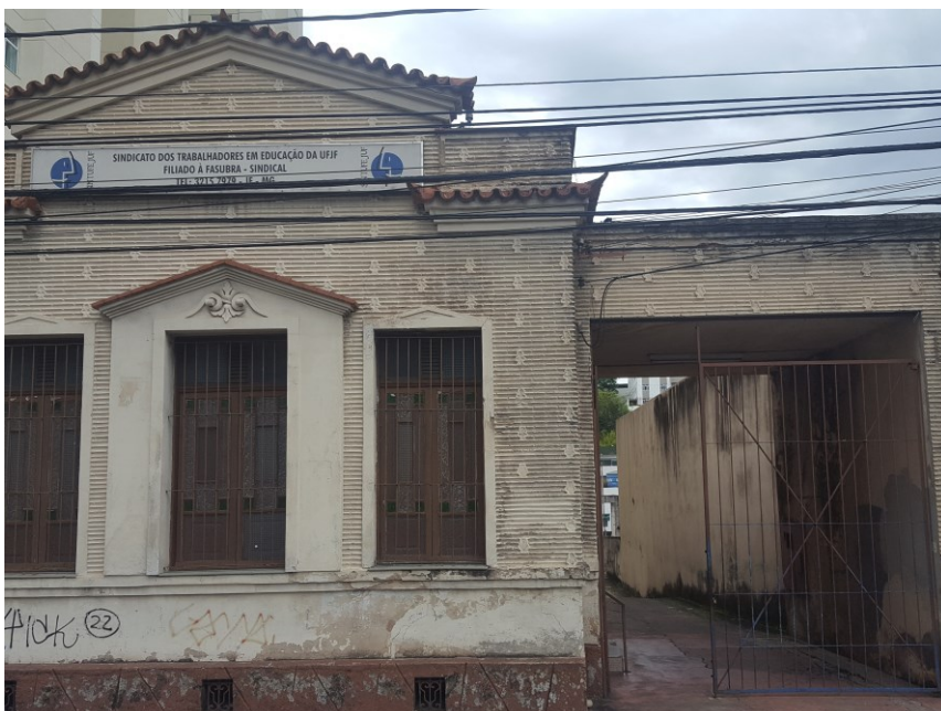
Fachada do imóvel na Av. Rio Branco 3460 fundos – Juiz de Fora – MG