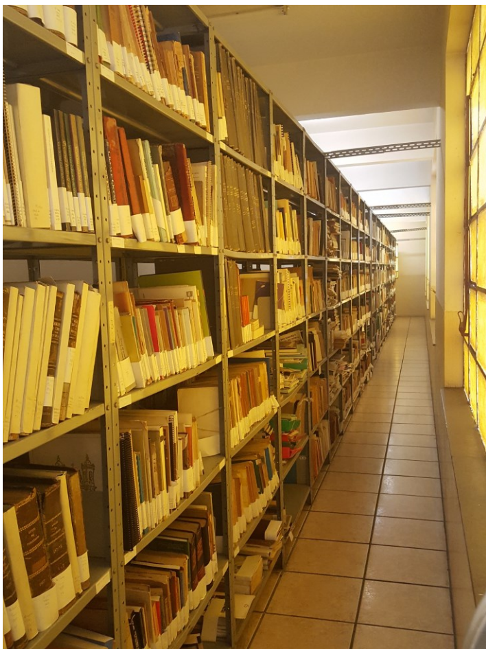
Biblioteca do Arquivo Histórico da UFJF