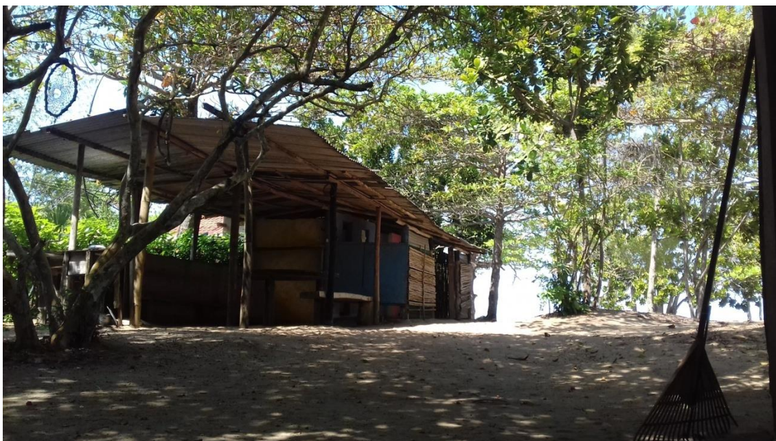
Figura 5: Foto do camping onde fiquei a maior parte do campo (out/2017).

A partir dessa experiência em campo, me estabeleci em um camping onde me mantive até o final das idas durante a pesquisa. O local, vide imagem a seguir (Figura 5), traduz bem o clima dos campings à beira mar, quintal de areia e com árvores frutíferas plantadas.