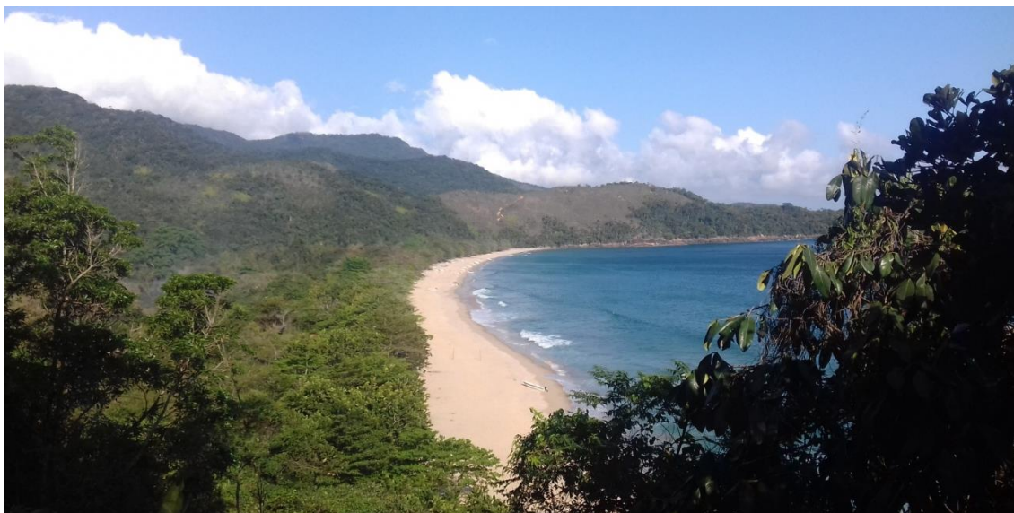
Figura 3: Vista da praia a partir do trecho final da trilha de acesso (out/2017)

Quando chove muito a trilha fica bastante escorregadia e alagada em certos trechos, às vezes pode deixar até alguma árvore caída, dificultando a passagem, principalmente de pessoas com algum tipo de dificuldade motora ou de idade mais avançada. Eu mesma já passei pela trilha em condições bem difíceis, o que fez com que o tempo de percurso aumentasse bastante.