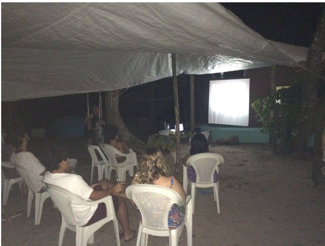
Figura7. Foto da atividade do cine-caiçara realizado na praia no dia 5 de janeiro

se reconheciam nos vídeos e deixavam escapar sorrisos. A Figura 7 abaixo traz o registro de um momento da atividade do cine-caiçara.