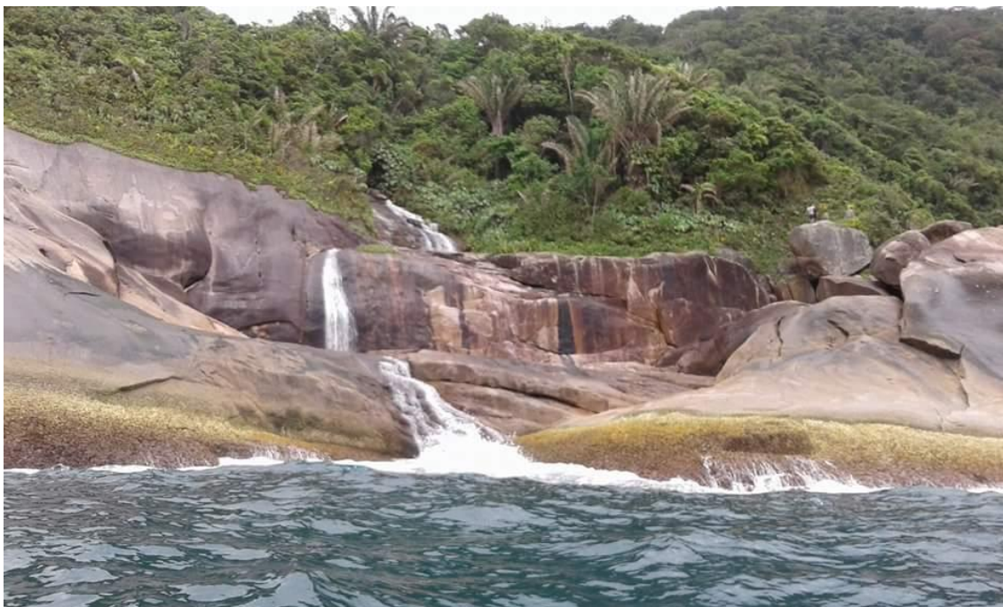
Figura 4: Cachoeira do Saco Bravo vista de barco pelo mar (Jan/2017).

Nesses dias no Sono, conheci turistas de São Paulo, Salvador e Buenos Aires. Encontrei também um turista que havia ido para o ano novo e ainda estava pela praia. Quando em Martim de Sá, nos dias anteriores, também encontramos alguns turistas que haviam permanecido na praia desde o feriado de réveillon. Percebi que existe um nicho de turistas que é interessado em dispendir uma quantidade maior de dias nas duas praias, e que existem muitos turistas recorrentes, que estão constantemente nas comunidades. Muitos são já conhecidos dos caiçaras. Em alguns casos, em ambas as praias, esses turistas estendem o prazo de estadia realizando também trocas não monetárias, como o serviço nos campings e bares. Esse é mais um aspecto onde se identificam pontos que fogem à lógica do sistema capitalista e se enquadram nos elementos da sociologia das emergências.