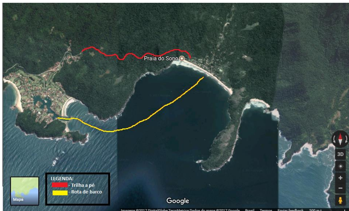
Figura 1: Mapa da praia e seu entorno, extraído do Google Maps e com grifos próprios: Em vermelho a rota aproximada da trilha a pé (saindo da Vila Oratório) e em amarelo o percurso de barco (saindo do Condomínio Laranjeiras).

Os caiçaras, ao lado de indígenas e quilombolas, tiveram e ainda têm um papel periférico no sistema político econômico. São populações que foram submetidas ao poder dos colonizadores, dos senhores de engenho, posteriormente dos empresários e por fim da classe média urbana e do Estado (ADAMS, 2002). É, como define Adams (IBID), um processo histórico de exclusão socioeconômica e ecológica.