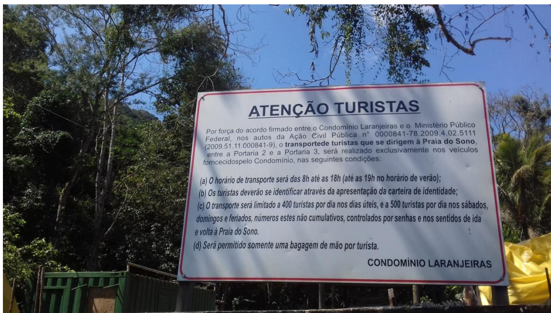
Figura 6: Placa informativa aos turistas por parte do Condomínio Laranjeiras