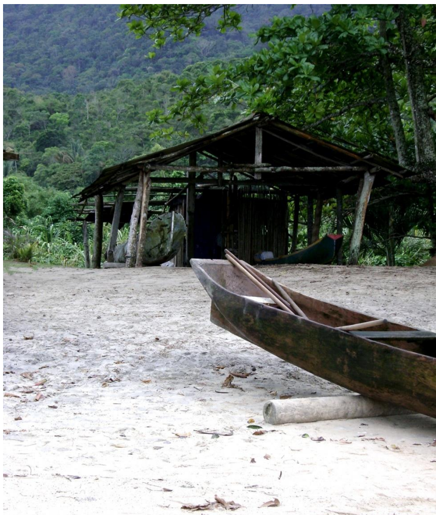
Canoa caiçara na praia.