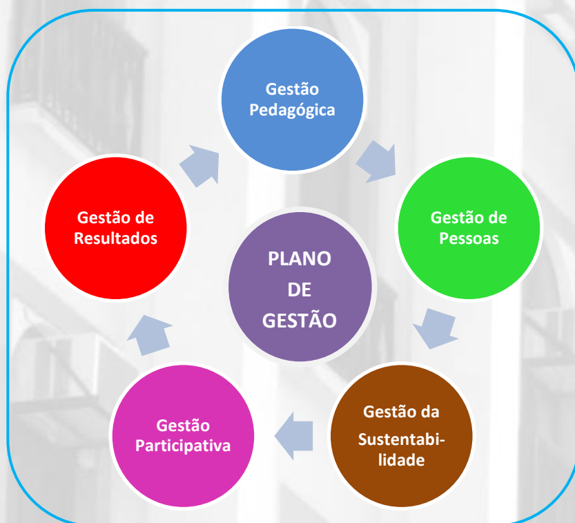
Figura 1 . Plano de Gestão (Operacionalização e Orientação)

O Plano de Gestão deve apresentar compatibilidade com os demais processos que compõem o Plano de Desenvolvimento Institucional (PDI) da UNIRIO. Sua elaboração é coordenada pela Pró-Reitoria de Planejamento (PROPLAN) e tem a participação de todas as unidades acadêmico-administrativas da Universidade.