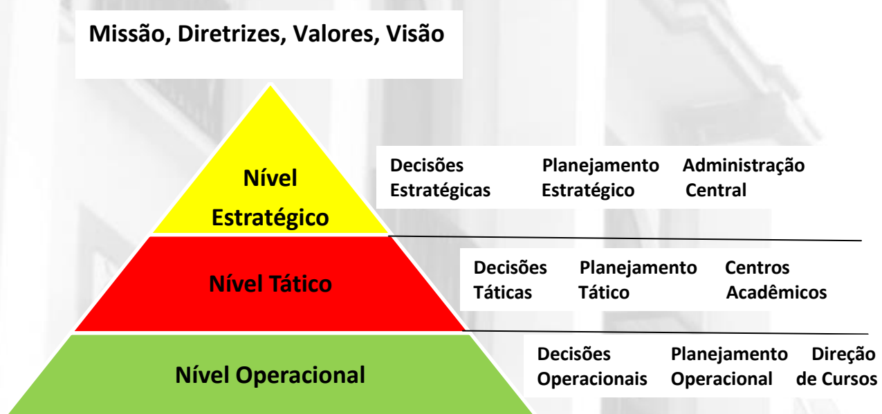
Figura 4. Níveis de Planejamento

São atitudes e tomadas de decisão necessárias ao cumprimento da meta.