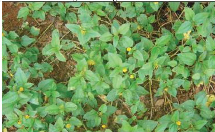
Figura 5 - Fotografia Jambu