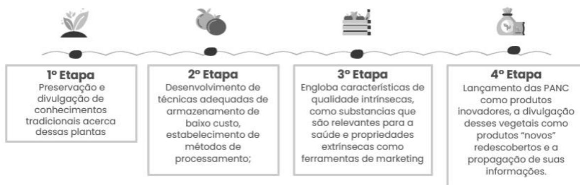
Figura 1 - Etapas da Cadeia de Valor