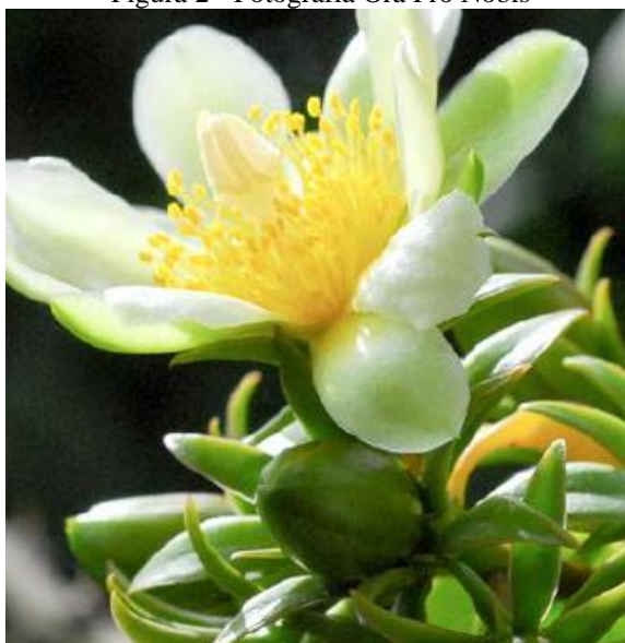
Figura 2 - Fotografia Ora Pro Nobis