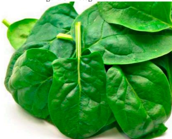
Figura 6- Fotografia Bertalha