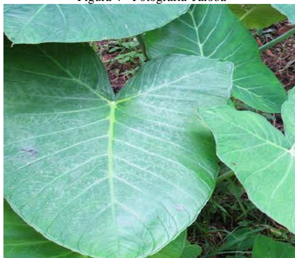
Figura 4 - Fotografia Taioba