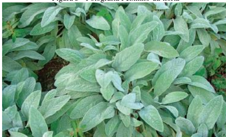
Figura 3 - Fotografia Peixinho-da-horta