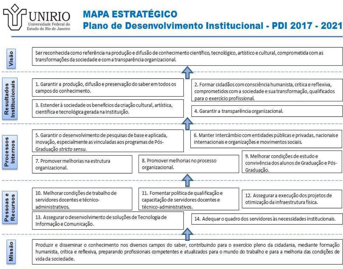
Figura 03: Mapa Estratégico

Elaboração: Pró-Reitoria de Planejamento - 2016