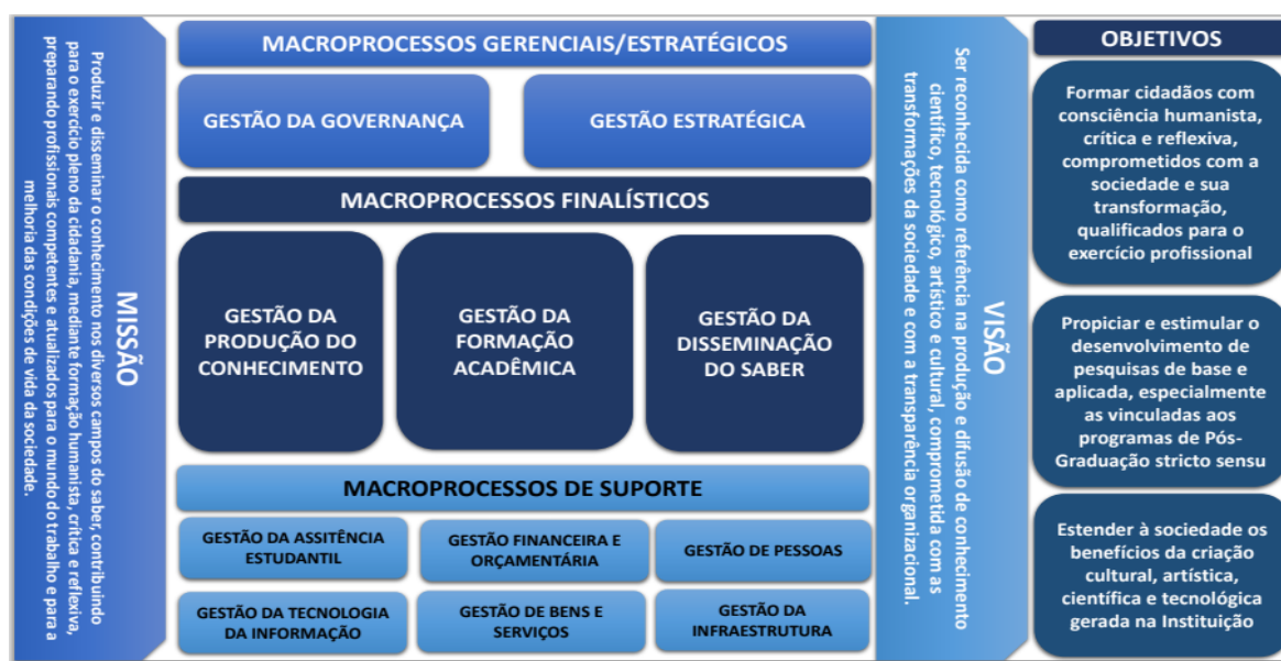
Figura 04: Cadeia de Valor da UNIRIO

Fundamentada nos três pilares básicos da Universidade: ensino, pesquisa e extensão, Cadeia de Valor da UNIRIO, apresentada no Relatório de Gestão 2019, definiu os macroprocessos da instituição, em que cada um possui os seus próprios processos, com a finalidade de agregar valor para o cliente ou cidadão/usuário por meio do serviço prestado, conforme figura abaixo: