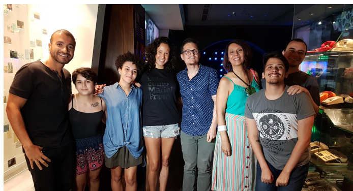
Evento do Projeto "Museologia do indizível" no Museu das Telecomunicações

Na área de pesquisa, o LAMEX possui dois projetos: Museologia do Indizível e Musealização e Descolonização. O primeiro visa a valorização e registro da memória LGBTI no Rio de Janeiro.