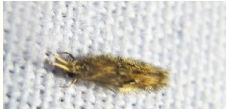
Inseto adulto da ordem Trichoptera

Grande parte do trabalho é a descrição de novas espécies, através da análise do material coletado nas pesquisas de campo, em parques estaduais, como também pelo recebimento da doação de amostras oriundas de todo o Brasil e de países como Austrália, China, Tailândia, EUA, Venezuela e Porto Rico.