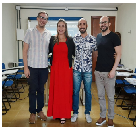
Evento UNIRIO DE BRAÇOS ABERTOS para docentes

PROGEPE informa sobre procedimentos para tomar mais rápida e segura as solicitações dos servidores