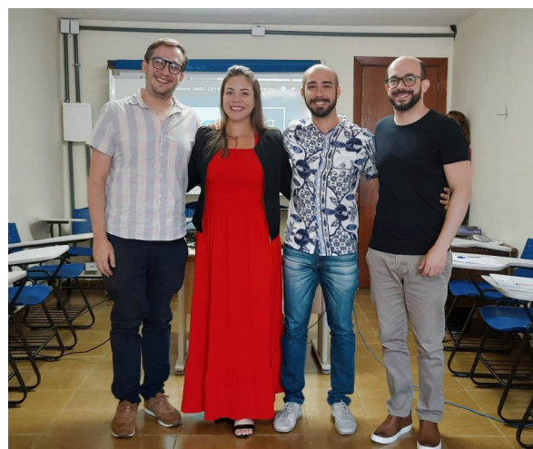
Os três novos docentes foram recepcionados pela Pró-Reitora de Gestão de Pessoas

O "UNIRIO de Braços Abertos" foi criado em 2015 para facilitar o processo de adaptação do novo servidor junto à Universidade, através da identificação com a cultura organizacional, por meio de informações essenciais para o início de suas atividades.