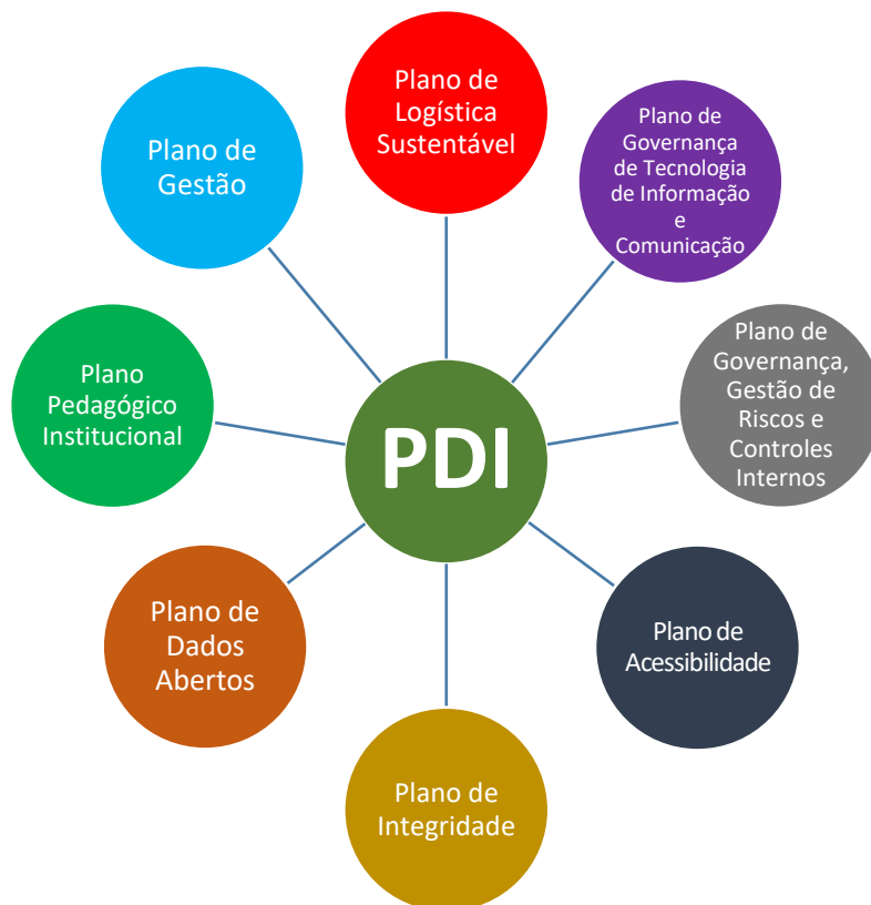
Figura 3: Articulação dos planos estratégicos da UNIRIO

Com base no PDI 2017-2021, todo o marco regulatório da Universidade foi elaborado e/ou atualizado, como mostra a figura a seguir: